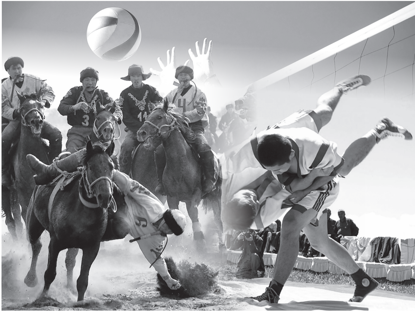
Коллажы жасаған Ш.Адамбекова

Бүгінгі таңда облыс бойынша 388 спорт нұсқаушысы жұмыс істейді. Оның 143-і ауылдық жердегі нұсқаушылар. Әрине, бұқаралық спорттың даму сатысындағы бір маңызды мәселе осы емес пе? Осы тұрғыда