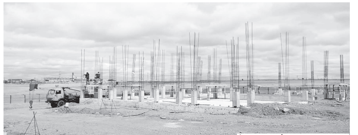
Атамекендегі мектеп құрылысы