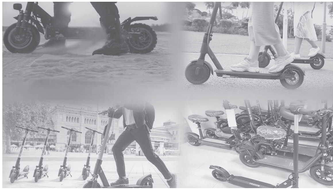
Коллаж жасаған Айбек РАХЫМЖАН

Танымалдылығы артқан электронды көліктер еліміздің барлық қаласында бар. Көшелерде, жолда тұрғанын жиі байқайсыз. Осыған орай, биыл мамыр айының бірінші жартысында Мәжілісте «ҚР кейбір заңнамалық актілеріне жол жүрісін ұйымдастыру мәселелері бойынша өзгерістер мен толықтырулар енгізу туралы» Заң қабылданғаны белгілі. Жобаға сәйкес, электросамокаттар көлік құралы ретінде танылады, сондай-ақ жүру жылдамдығы сағатына 25 шақырымға дейінгі көлік құралдары электросамокат санатына жатады. Электросамокаттар велосипед жол-