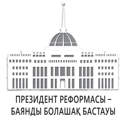
ПРЕЗИДЕНТ РЕФОРМАСЫ – БЯНДЫ БОЛАШАҚ БАСТАУЫ

дағы шығаруға дайын күйінде қорап қағазға түседі. Бағасы да қымбат емес, қалтаға салмақ салмайды. Тап осы технологиямен сиыр сүтін де