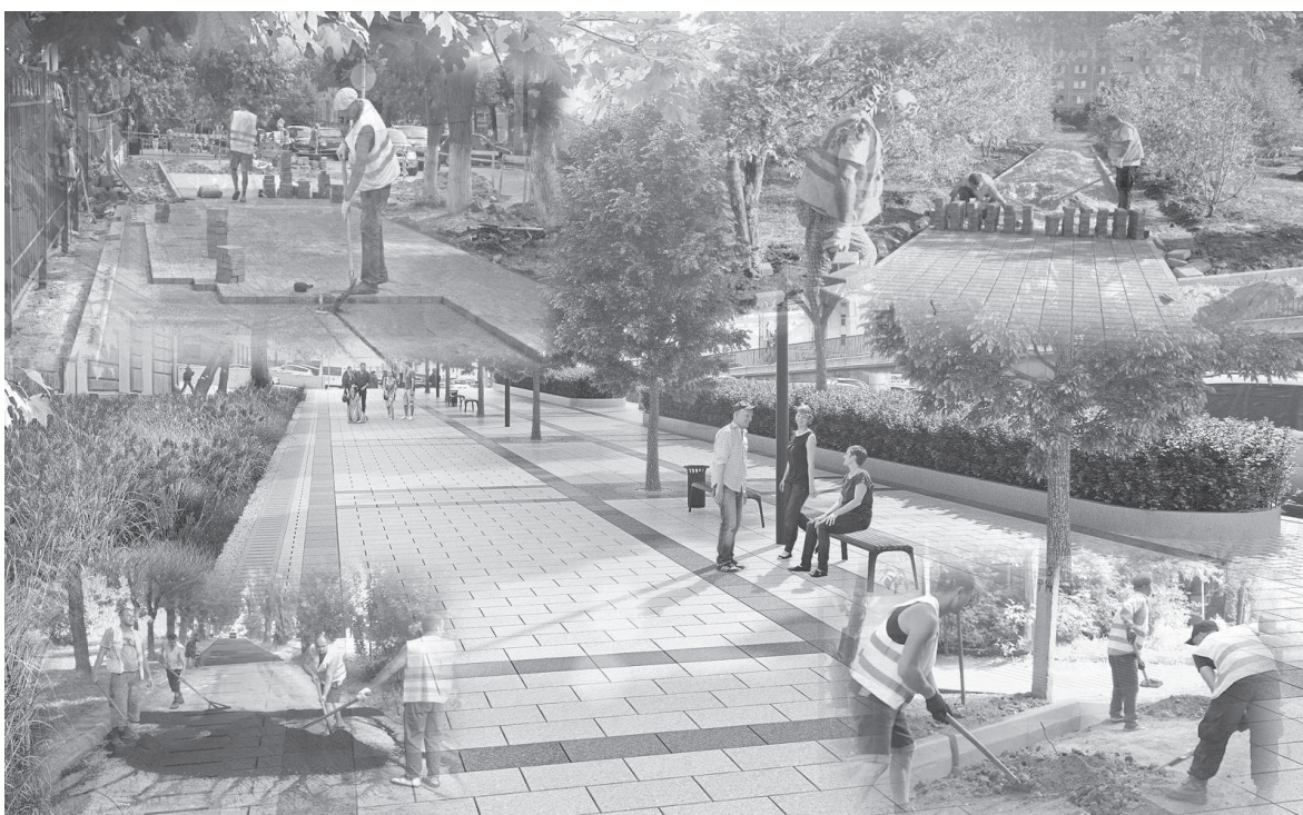
Коллаж жасаған Айбек РАХИМЖАН

Қала шетіндегі қараусыз қалған саябақты қалпына келтіру де қолға алыныпты. Пришахтинск саябағы ұзақ уақыт бойы қараусыз қалып, құлдырап кеткен еді. Бюджеттен