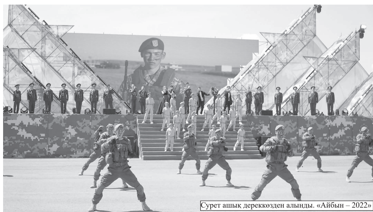
«Айбын – 2022»

Жас буынның бала кезінен патриоттық сезімін қалыптастыруға «Айбынның» ықпалы зор. Бүгінде «Айбын» әскери-патриоттық жиынының алғашқы қатысушылары болған жас сарбаздар елімізде ғана емес, алыс-жақын шетелдерде білім алып, ел игілігіне