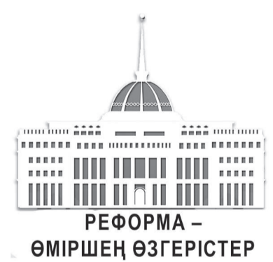
РЕФОРМА – ӨМІРШЕҢ ӨЗГЕРІСТЕР

кәсіптік бейімдеу мақсатында оқушыларды даярлайтын республикалық үш «Жас ұлан» мектебі бар. Олар Алматы, Шымкент, Қарағанды қалаларында орналасқан. Бұл мектептер 2015 жылдан бері ҚР Қорғаныс министрлігіне қарайды. Сонымен қатар, Астана қаласында Армия генералы Сағадат Нұрмағамбетов атындағы Әскери колледжде де білім алады. Жыл сайын жоғары әскери оқу орындарына тәрбиеленушілердің шамамен 55-56 пайызы оқуға түседі екен.