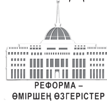
РЕФОРМА – ӨМІРШЕҢ ӨЗГЕРІСТЕР

Бүгінде Приозерск өңіріндегі кәсіпкерлер көл жағасында пайда тауып, түрлі қиындықтан да біртіндеп өтуде. Маусымдық туризм ауа райына тәуелді. Өйткені, табиғаттың атуы – табиғат. Дегенмен,