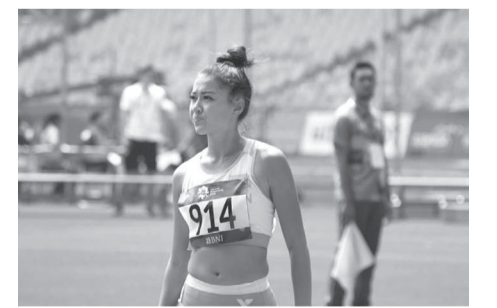
Дайындаған Жан АМАНТАЙ, «Ortalyq Qazaqstan»

Жарысқа еліміздің барлық өңірлерінен спортшылар қатысуда. Ұлттық құрамның барлық өкілдері марапаттан демелі. Бұл дегеніміз спортқа көңіл бөлініп, ден қойылды дегенге саяды. Аталмыш турнир үш күнге созылады.