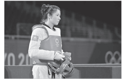
Дайындаған Жан АМАНТАЙ, «Ortalyq Qazaqstan»

Әлемдік біріншілік 4 маусымға дейін жалғасады.