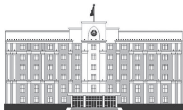
ҚАРАҒАНДЫ ОБЛЫСЫНЫҢ ӘКІМДІГІ

Қарағанды облысындағы 172 мың оқушы 1 маусымнан бастап, жазғы демалысқа шығады. Облыс әкімдігінде өткен аппарат кеңесінде аймақ басшысы Ермағанбет Бөлекпаев жазғы демалыс кезінде кәмелетке толмаған балалардың қауіпсіздігін қамтамасыз етуді және қауіпсіздікті күшейтуді тапсырды.