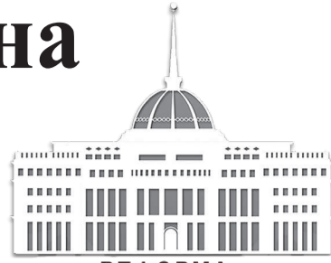
РЕФОРМА – ӨМІРШЕҢ ӨЗГЕРІСТЕР

орын алған жағдайда да аталған органға жүгінуге болады. Жалпы, ресми мәліметтер облыс мектептерінде буллингке қатысты оқиғалар тіркелмегенін көрсетеді. Бұл аталған мәселеге бей-жай қарау керек деген емес. Бала құқықтары жөніндегі уәкіл жанындағы Жастар кеңесі өткізген «Буллинг менің мектебімде жоқ» атты вебинардан кейін балалардан бірнеше қоңырау түскен.