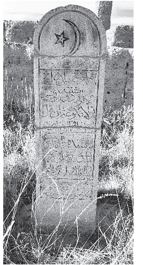
байланысты зерттеуші ғалым С.Әжіғали бірнеше топқа бөлген.

Қайтыс болған адамды алдымен халық жырыммен жоктайтын болды. Сонымен қатар, қабір басына қойылған құлпытас пен жоқтау жырының мақсаты ортақ, біріндегі олқылықты екіншісі толтырып, мәңгілік ескерткіш қалдырды. Құлпытас жасау, қою – қазақ халқының тас өңдеу өнерінің мемориалдық бағытының ерекше бір бағыты. Құлпытастың кіші мемориалдық ескерткіш ретінде қалыптасуы жайында тарих ғылымында, әр кезеңде әртүрлі пікірлер айтылған. Алғашқы пікірді 1898 жылы А.Мұстафин түркі дәуірінің сынтастарымен қазақ құлпытастарын байланыстырады. Бұл пікірді кейін басқа зерттеушілер М.Меңдіқұлов пен Б.Ибраев қолдаған болатын. Құлпытастың шығу тегі Т.Басеновтің пікірінше, сынтастармен байланысты. Осы гипотеза Э.Масановтың еңбегінде қолдау тауып, қазақ құлпытастарының антропоморфтық қалпынан бас