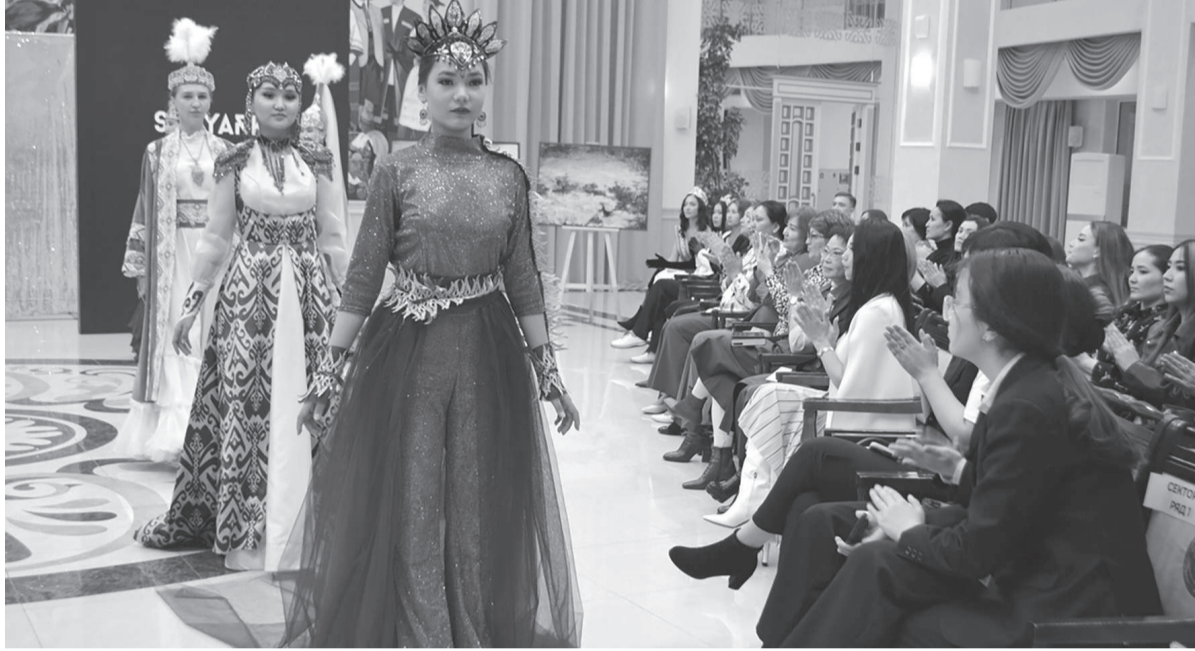
Мұнда 10-ға жуық қатысушы дизайнерлер бас қосты. Бұған дейін «Шығармашыл жастар арасында жана мүмкіндіктер» форумы «Аманат» партиясының ғимаратында өткен еді.