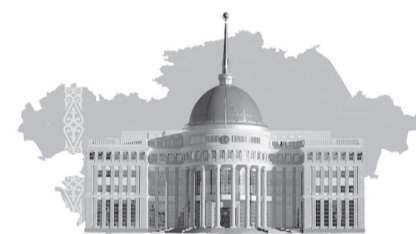
ПРЕЗИДЕНТ ЖОЛДАУЫ – ЕЛ МҮДДЕСІ

Ауру қоздырғышы топырақта болады. Бакты ауылында қар еріп, мал ерте көктемнен жайылымға шыққан. «Ауру содан болуы мүмкін» деп топшылайды мамандар.