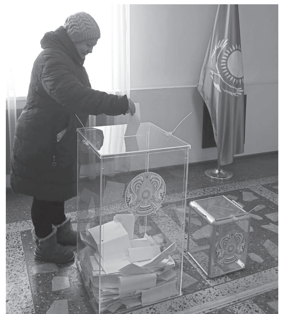
да қайта қалуына «көкелерінің» емес, көпшіліктің қолдауы, халықтың сенімі көмектескеніне көзіміз жеткендей. Абай ауданы