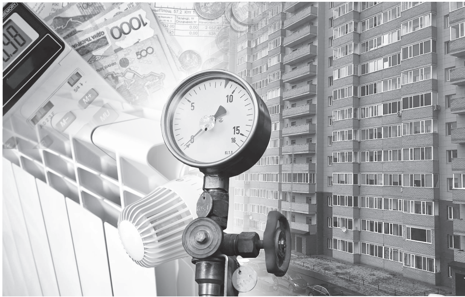
Коллаж жасаған Шынар Аманбекова

Сол себепті де ПИК секілді басқарудың мән-маңызы қалмағанын билік те атады. Содан осындай жаңалықтармен тұрғын үй шаруашылығын «серпілтісі» келеді. Негізінен, өте құптарлық. Өз тын-тебенін бір үйі бір өзіне жаратуы, оның есеп-кисабы көз алдында тұруы «бітпес даудан» құтқарады. Шашылып қалған шаруашылығын қалпына келтіреді. Былайша айтқанда, «Ортақ өгізден оңаша бұ-