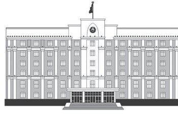
ҚАРАҒАНДЫ ОБЛАСЫНЫҢ ӘКІМДІГІ

Осакаров, Бұқар жырау аудандарында, сонымен қатар Ақтоғай және Қу орман және жауаулар дүниесін қорғау шаруашылықтарында өрт сөндіру станцияларын салуға биыл қолмақты қаражат бөлінді.