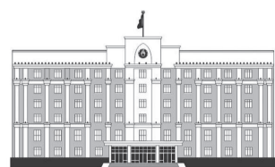
ҚАРАҒАНДЫ ОБЛАСЫНЫҢ ӘКІМДІГІ

зды. Себебі, біз адам құқықтарын қорғаудың басқа түрлері болмаған кезде әрекет етеміз. Сондықтан, атқарушы немесе құқық қорғау органдарының құзыретін алмастырмаймыз, керісінше, толықтырамыз, – деді омбудсмен.