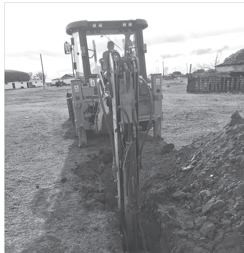
Ауылға ауыз су тартылуға