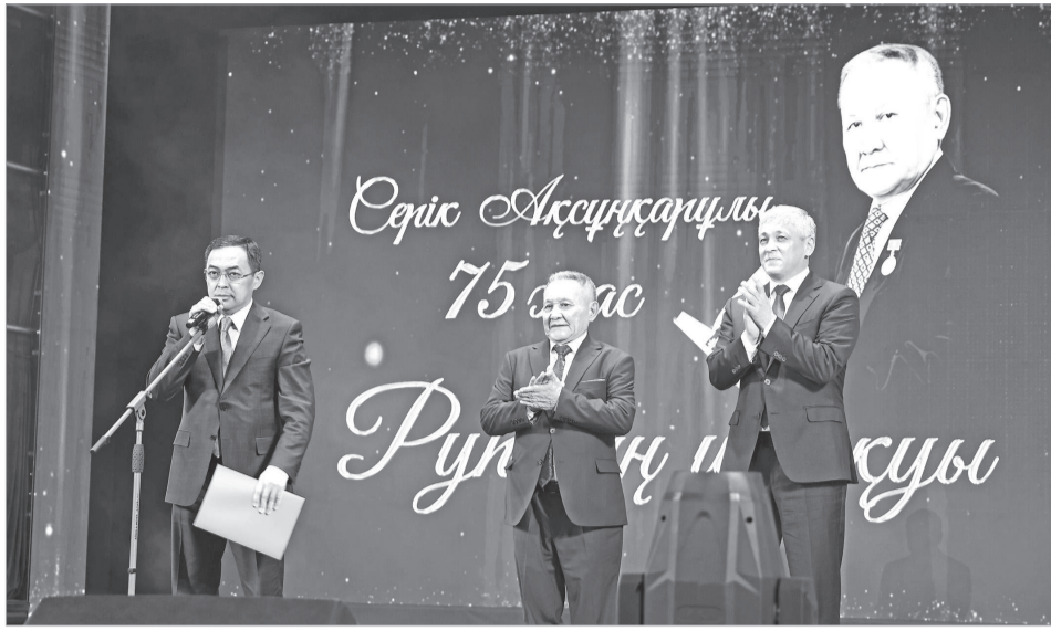
(Соңы. Басы 1 бетте)

Сонымен қоса, кеш иесі Серік Ақсұңқарұлына Мемлекеттік кеңесшісі Ерлан Қариннің құттықтау хатын Қалқаман Сарин, Мәдениет және ақпарат министрі Аида Балаеваның хатын министрліктің Архив құжаттама және кітап ісі комитеті Кітап ісі басқармасының басшы-