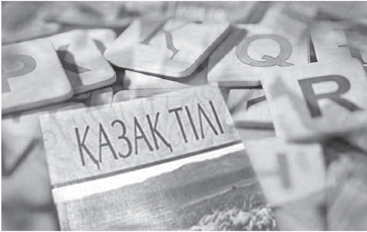
Сурет шық. перекөздер