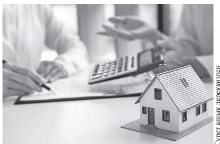
Сурет шық бермеген

17 наурыздан бастап, өнеркәсіп, энергетика, көлік, ауыл шаруашылығы және су ресурстары салаларының қызметкерлері үшін «Наурыз жұмыскер» ипотекасына қабылдау басталады.