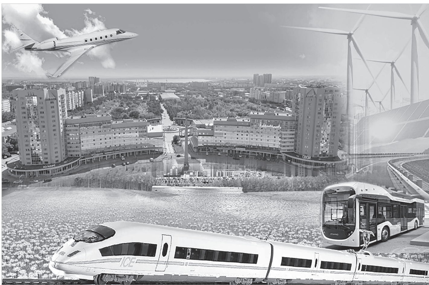
Коллаж жасаған Шынар Адамбекова

Соңғы жылдары облыста инфрақұрылымды дамыту бағытында ауқымды жұмыстар атқарылып, Президент Қасым-Жомарт Тоқаевтың жыл сайынғы Жолдауларында белгіленген тапсырмалармен етене байланысты өрістеп келеді. Облыс әкімі Ермағанбет Бөлекпаевтың басшылығымен жүзеге асырылып жатқан жобалар өңірдің әлеуметтік-экономикалық дамуына сүбелі үлес қосуда.