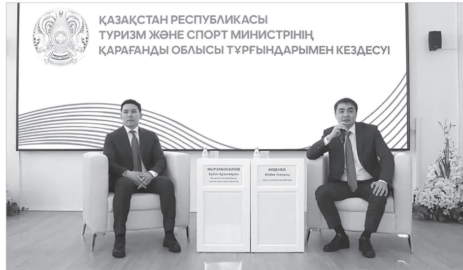
Ербол ЕРБОЛАТ, «Ortalyq Qazaqstan»

Елімізде спорт және дене шынықтырумен жүйелі шұғылданатын азаматтардың саны 8,4 миллионға жетті. Ауылдық жерлерде 3,1 миллион адам спортпен шұғылданады. Ал, аймақта 442 мың адамға жеткен. Соның ішінде, балалар мен жасөспірімдердің саны 79 мыңнан асып жығылады. Осы және туризм, спорт және ойын бизнесі саласында жүргізіліп жатқан реформалар жайында Туризм және спорт министрі Ербол Мырзабосынов Қарағанды жұртымен кездесуінде айтып берді. Әрі көпшіліктің сауалына жауап беріп, атқарылған жұмыстары жайында есеп берді.