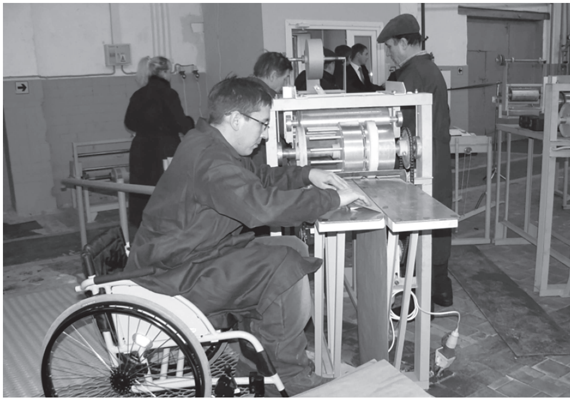
Сурет ШИМК ДИРЕКТОРЫН АЙТАДЫ

Мүгедектігі бар адамдарға арналған арнайы жұмыс орындары