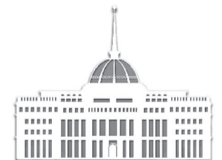
Реформа – өміршең өзгерістер

ды тағамтану және сервис колледжінде шағын наубайхана ашылды. Жоба студенттерді кәсіпке үйретіп, колледждің материалдық-техникалық базасын жақсартуға бағытталмақ.