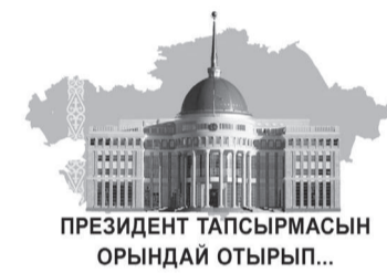
ПРЕЗИДЕНТ ТАПСЫРМАСЫН ОРЫНДАЙ ОТЫРЫП...

– Жоба бойынша 3 100-ге жуық жұмыс орны ашылды, 1 600-ден астам келісімшарт жасалды. Қазіргі уақытта 2 500 адам «Күміс жас» жобасы бойынша жұмыс істеп жүр. «Күміс жас» кейін «Алтын жаспен» жалғастырып кетуге болады. Жалпы, адам саны да, жұмыс берушілер де көбейді. Статистика өсіп жатыр. Жекеменшік балабақшаларға тәрбиешілер, мектептерге педагог, зауыттарға мамандар іздеген сұраныстар түседі.