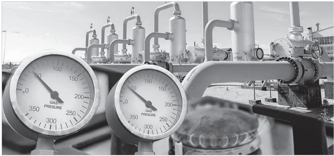
Коллажды жасаған Арайлым Қожаева

Маңызды мәселенің бірі – тұрғын үйлерді орталық газбен жабдықтау. Бүгінде үйлерді көмірден газға ауыстыру жұмыстары жүргізілуде. Бұл жайлы облыс әкімдігінде өткен аппарат кенесінде айтылды.