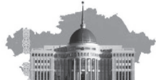
Президент тапсырмасын орындай отырып...

Балқаш қаласында баспана мәселесін шешудің бір жолы ретінде үй саламын дегендерді жеке тұрғын үй құрылысын жүргізетін жер телімдерімен қамтамасыз ету қарастырылып отыр. Шағын шаһарда да атқарылып жатқан ілкімді істер аз емес. Оның көпшілігі көңілге қонады, халықтың да қуанышын еселеп отыр.