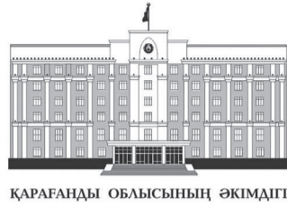
ҚАРАҒАНДЫ ОБЛАСТЫНЫҢ ӘКІМДІГІ