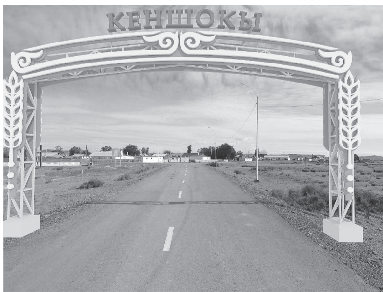
Сурет ашық дереккөзінен