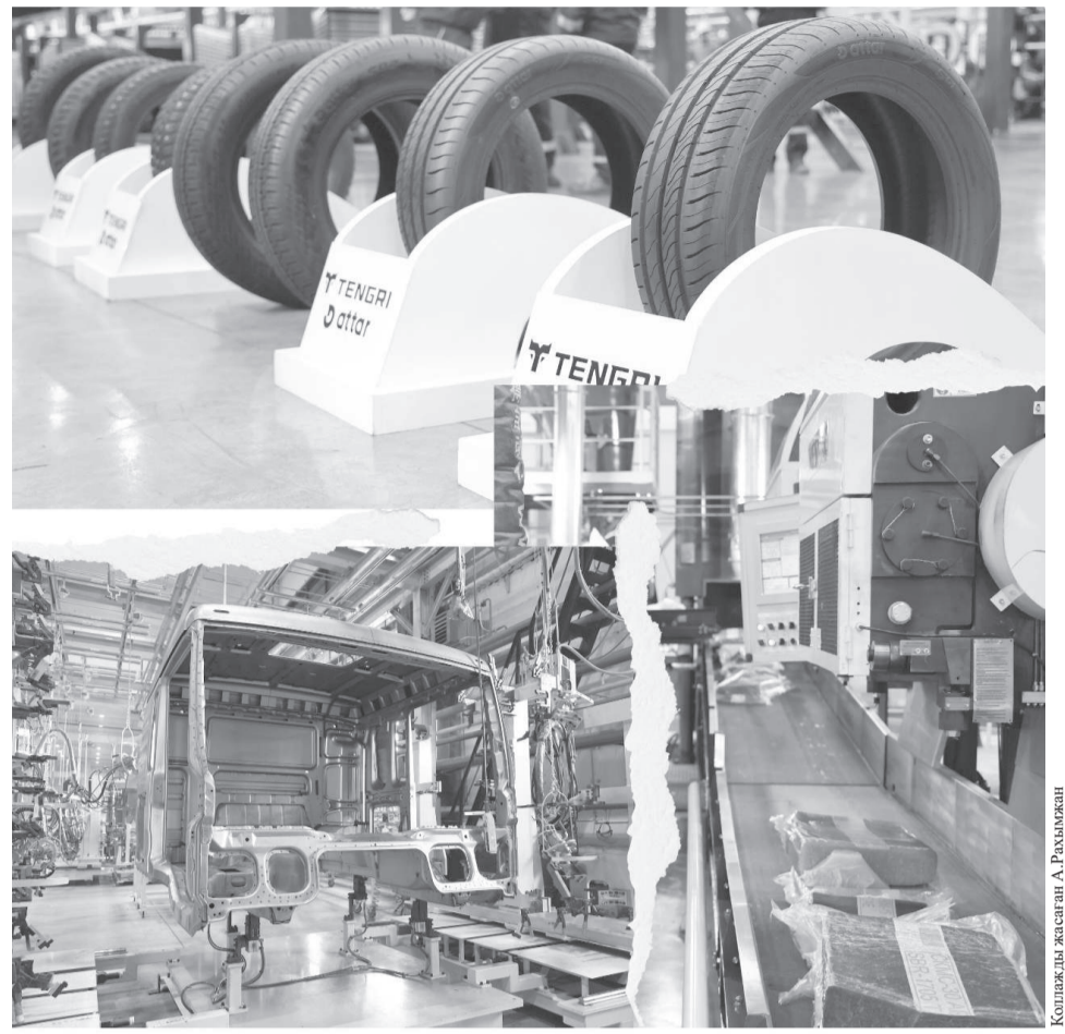
Көпшілік жасаған А. Рақышев

Қара металлургия саласы да елеулі орын алады. Аталған салаға 256 миллиард теңге көлемінде инвестиция салынып, өндірістік қуаттардың артуына, жаңа жұмыс орындарының ашылуына және металлургия өнімдерінің ішкі нарықта үлесінің өсуіне игі ықпал етеді. Кешенді сектордың дамуында республиканың өнеркәсіптік