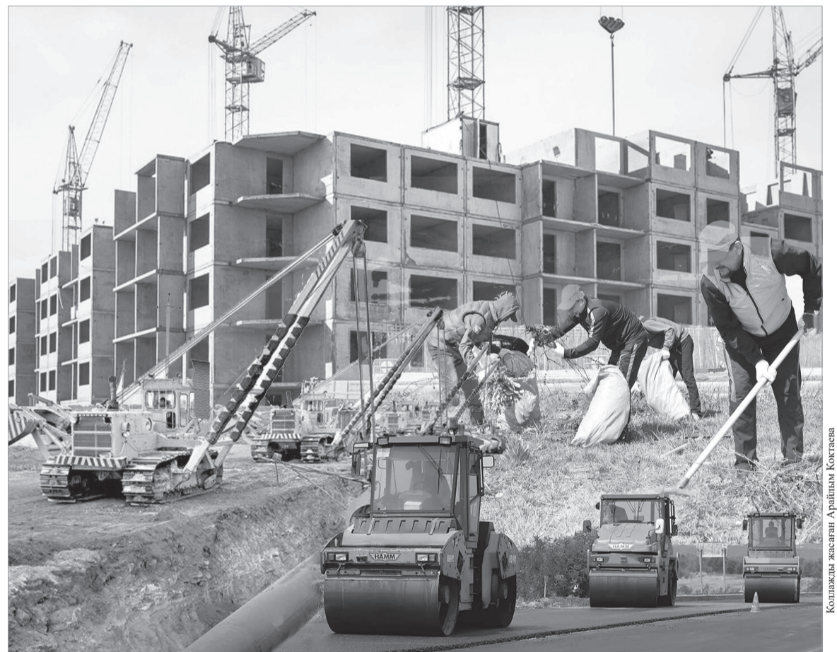
Қолжазба жасаған Аралшын Қолжазба

Сондай-ақ, жылу тораптарының тозуын азайту мақсатында Молодежный көшесіндегі жалпы ұзындығы 5 шақырымдай магистральдық құбыр өткізгіштерді реконструкциялау жөнінде жобалау-сметалық құжаттама жасалу сатысында. Шахтинск ЖЭС пен Шахан кентіндегі қазандықты жөндеу бойынша жұмыс жоспары то-