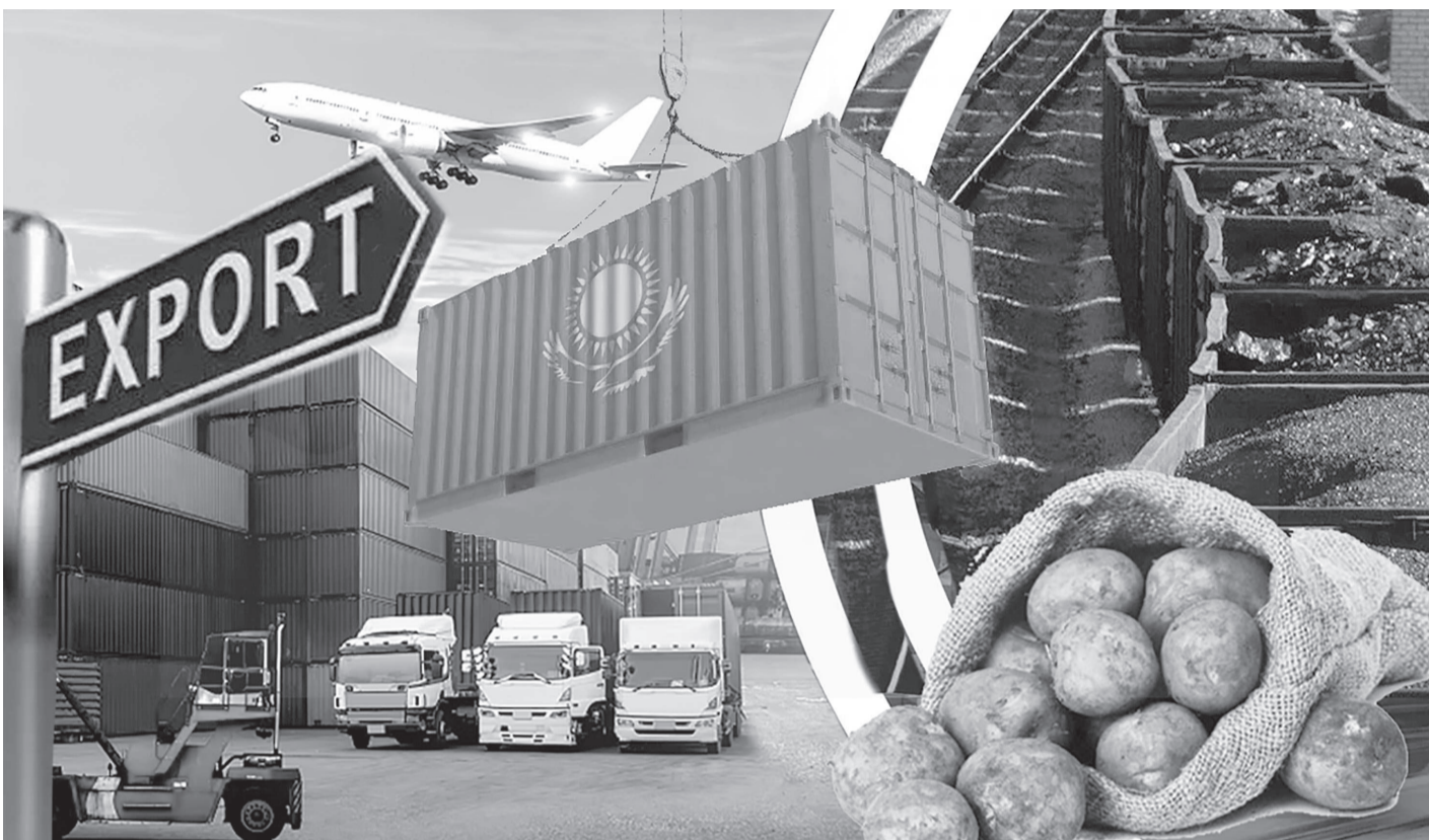
Қолжазба авторы: Арпайым Қожаева

Қазақстан Республикасының Президенті Қасым-Жомарт Тоқаевтың ел тізгінін қолына алған соңғы алты жыл ішінде түрлі сын-қатерлерге қарамастан ілгерілеуге бастаған талай ауқымды істер қолға алынды. Соның ішінде, ел экономикасын әртараптандырып, экспорттық әлеуетті арттырумен қатар, жаңа нарықтарға жол ашқан сыртқы сауданы ерекше атауға болады. Атап айтқанда, статистикалық деректер осы жылдары елімізде сыртқы сауда 1,5 пайызға өскенін көрсетеді. Мемлекет басшысы да сыртқы сауда саясаты еліміздің экономикалық қауіпсіздігін қамтамасыз ету және халықтың әл-ауқатын арттыру үшін маңызды екенін үнемі айтып келеді. Оның пікірінше, Қазақстанның сыртқы сауда саясаты ашықтыққа, бәсекеге қабілеттілікке және халықаралық стандарттарға сәйкес болуға тиіс. Қарағанды облысы да ел экономикасын арттыруға үлес қосуда көш басында. Мәселен, Ұлттық статистика бюросының мәліметінше, 2025 жылғы қаңтарда Еуразиялық экономикалық одақ елдерімен өзара сауда 165 млн АҚШ долларын құраса, оның ішінде, экспорт – 89,2 млн АҚШ долларына жеткен.