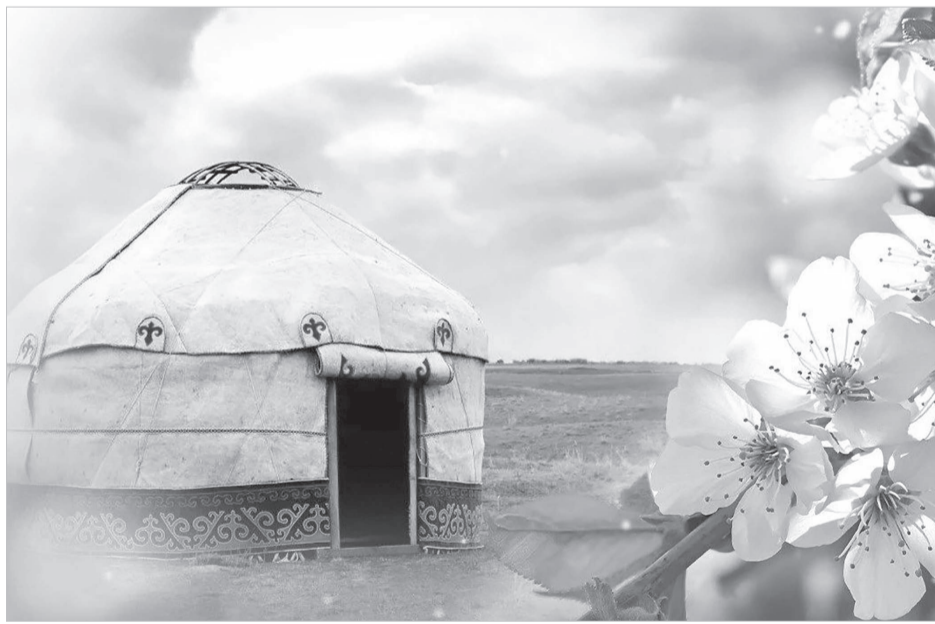
Сурет ашық дереккөзден алынған

Наурызнама – ұлтты ұйыстырған мейрамның жаңаша сипаты. Былтыр басталған Наурыз тойының он күндігі олжалы. «Тойдың тамашасын емес, тағлымды бақ» дейді. Осы орайда Наурызнаманың әр күні қазақ халқы үшін тағлымды таудай. Мемлекет басшысы Қасым-Жомарт Тоқаев «Egemen Qazaqstan» газетіндегі «Біз озық ойлы ұлт ретінде тек қана алға қарауымыз керек» атты сұхбатында Наурыз мейрамының жаңарып, жаңғырып келе жатқаны жөнінде атап өтеді.