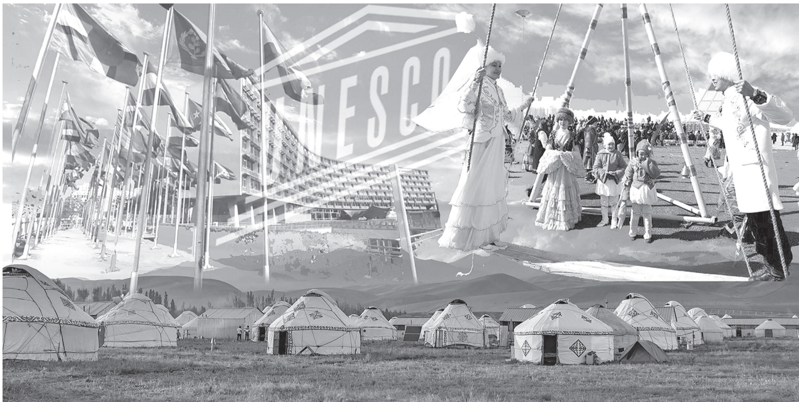
Коллекция жазығы А. Көктем

Екіншіден, Наурыз – ғасырлар бойы қалыптасқан дәстүр мен ха-