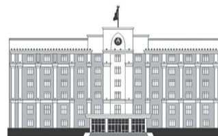
ҚАРАҒАНДЫ ОБЛЫСЫНЫҢ ӘКІМДІГІ

Жалпы, өңірлік бөлімшелерді дайындауға ерекше назар аударылу екенін айту керек. Қарқаралы, Ақтоғай, Шет және Осакаров аудандарына бөгеттер мен бөгет құрылыстарын нығайту, су бұру арықтарын тазартуға қосымша техника мен құтқарушылар жіберілді.