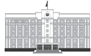
ҚАРАҒАНДЫ ОБЛЫСЫНЫҢ ӘКІМДІГІ

және басқа да аудандарда өткен күндері каналдар мен су өткізу құбырлары тазартылды. Бұл жұмыстардың мақсаты – еріген қар суының кедергісіз ағуын, тасқының алдын алу. Одан бөлек, қар шығару жұмыстары жүргізіліп, су тасқынының алдын алу мақсатында арнайы жоспар құрылған болатын. Су тасқыны болуы ықтимал аймақтарда сақтық шаралары күшейтіліп, алдын ала әрекеттердің барлығы мұқият жоспарланып, жүзеге асырылуда. Сонымен қатар, су қоймаларына тасқын суларды қабылдау үшін қажетті көлемнің қорын құруға мүмкіндік беретін облыстың ірі