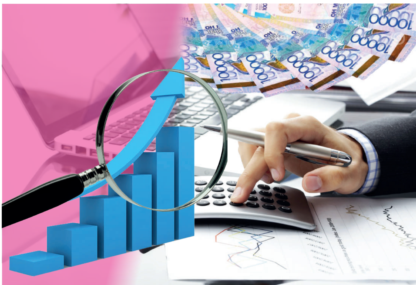
Коллажты жасаған Ш.Алимбаева