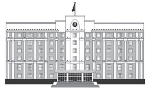
ҚАРАҒАНДЫ ОБЛЫСЫНЫҢ ӘКІМДІГІ

Қарағандыда жылумен жабдықтау сапасын жақсарту жұмысы жалғасып жатыр. Былтыр Қазыбек би ауданының Оңтүстік-Шығыс бөлігіндегі жылу қуаттарының тапшылығын жойтын үшінші жылу құбырының құрылысы аяқталған. Биыл Майқұдықтағы инвестициялық бағдарлама аясында Архитектурная көшесіндегі жылу желісін қайта құруды аяқтау жоспарланып отыр.