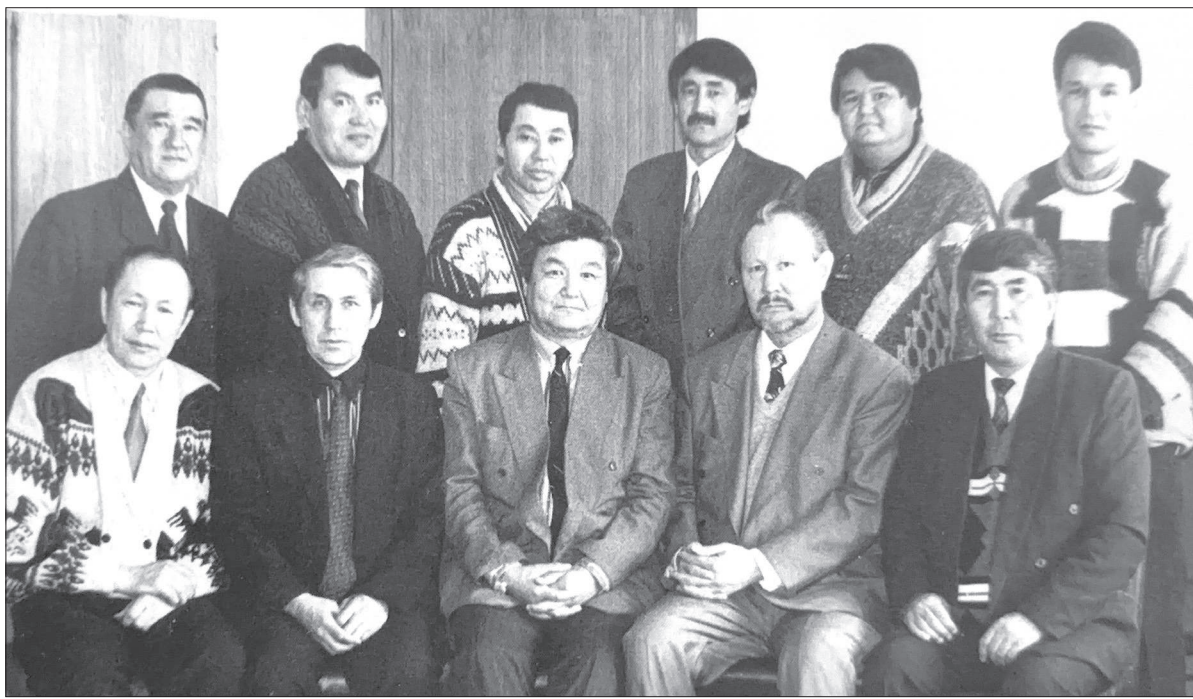
«Орталық Қазақстан» газетінің ұжымы жазушы-ғалым Ақселі Сейдімбекпен бірге. 1997 ж.