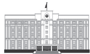
ҚАРАҒАНДЫ ОБЛЫСЫНЫҢ ӘКІМДІГІ

қалмайды. Сумен жабдықтауды жақсарту үшін мұнда желілердің жартысы ауыстырылды. Тоқырауын-Саяк су құбырын жөндеу жалғасады. Бұған қоса, Саякқа ауызу беретін тоған сорғы станцияларының көп жылғы мәселесін шешу қолға алынған. Жабдықтау өткен ғасырдың 60-шы жылдарынан бері жөнделмеген.