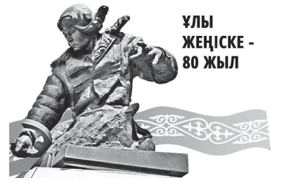
Ұлы Жеңіске - 80 жыл

– Мемлекет басшысы Қасым-Жомарт Тоқаев атап өткендей, Ұлы Жеңістің 80 жылдығын мерекелеу ерекше орын алады. Біздің әкелеріміз бен аталарымыз майданда жан алып, жан берді. Армияны қару-жарақпен, өнеркәсіптік тауарлар мен азықтүлікпен қамтамасыз етуде тыл еңбеккерлерінің орасан еңбегі сінді, – деді облыс әкімінің орынбасары Әлібек Әлденей.