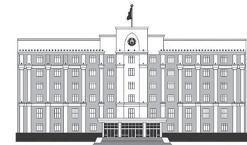
ҚАРАҒАНДЫ ОБЛЫСЫНЫҢ ӘКІМДІГІ

қарқындылығын ескере отырып, қиылыстардағы қозғалысты реттейтін болады. Осылайша автокөлік иелері жол жүру уақытын қысқарта алады.