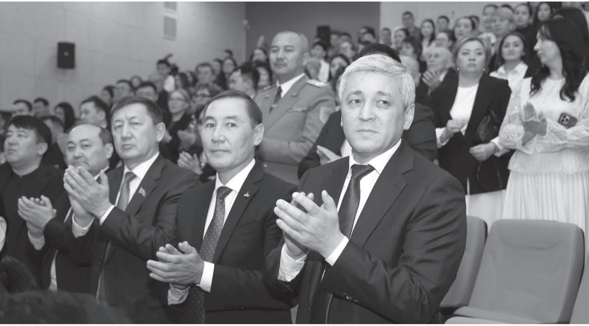
(Соңы. Басы 1-бетте).

40 жылға жуық оқытушылық қызметпен айналысқан ұстаз, информатика бойынша авторлық бағдарлама мен физика бойынша ғылыми-әдістемелік кешен әзірлеген. Оқушылары – көптеген халықаралық және республикалық байқаулардың жеңімпазы. Теміртау қаласында робототехниканы бірінші болып дамытқан мұғалім.