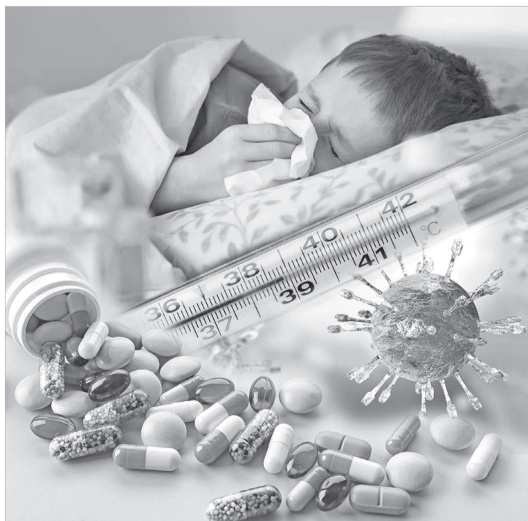
Коллекция: жетінін Ш.Алтынбаева

Бұл ретте аурудың асқынған жағдайлары иммунитеті әлсіреген адамдарда, үлкен кісілерде және 5 жасқа дейінгі балаларда байқалады. Асқынған салдарынан қайтыс болу деңгейі де төмен. Осыдан екі-үш жыл бұрын Lancet Global Health журналында жарияланған зерттеулерде 5 жасқа дейінгі балалардың өлім-жітімінің себебі жіті вирустық инфекциялар ішінде, метапневмовирустың үлесі 1% ғана. Дегенмен, интернеттегі кейбір деректерде метапневмовирустан болатын өлім-жітім 43%-ға жетуі мүмкін деген апарат бар. Алайда, бұл деректер қосымша тексеруді және растауды талап етеді. Себебі, көп жағдайда ауру жеңіл түрде жүреді. COVID-19-дан айырмашылығы, метапневмовирусты диагностикалау үшін скринингтік тесттер жеткіліксіз әрі