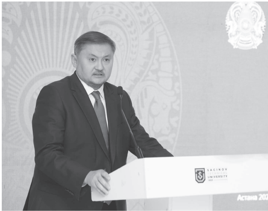
Президент тапсырмасын орындай отырып...

Ғылым мен бизнестің өзара ықпалдастығына ерекше көңіл бөлінді. Кәсіпорындар өкілдерінің, соның ішінде «Қазакмыс» корпорациясы мамандарының қатысуы осы бағыттағы байланыстың маңыздылығын көрсетті. Екі күндік жұмыс барысында ғалымдар ғылыми баяндамалар ұсынып, заманауи технологияларды енгізу тәжірибесімен бөлісіп, қолданбалы зерттеулерге негізделген