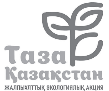
ЖАЛПЫАТТЫҚ ЭКОЛОГИЯЛЫҚ АКЦИЯ

Көтерілген мәселеге жастар тарапынан кері жауап та болды. Сарапшыларға сұрақ жолдап, идеяларымен бөлісті. Өрі жоспарланған іс-шараларға қатысуға да уағда етті. Енді үлкен жобалардың басы-қасында жүрген жастардың қатары көбейеді деген сенім мол.