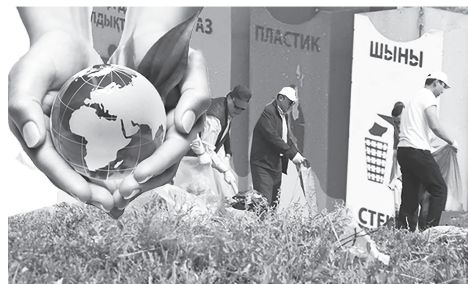
Қолжазды жасаған А. Коктаева

Қарағанды қаласы – ауасы ластанған қалалардың қатарында. Жиылған жұрт осы мәселені ортаға салып, өзара пікір алмасты. Биолог-оқытушы Денис Сирман