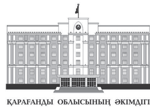
ҚАРАҒАНДЫ ОБЛАСЫНЫҢ ӘКІМДІГІ

Облыста көктемгі егіс жұмыстарына дайындық басталып кетті. Биыл ауыл шаруашылығы дақылдары 1 млн 188,6 мың гектарға себіледі. Бұл өткен жылмен салыстырғанда 100,3 мың гектарға артық. Ал, дәнді дақылдар 956,9 мың гектар жерді алады. Одан бөлек, майлы дақылдар алқабы да өткен жылмен салыстырғанда 11,8 мың гектарға ұлғайғанын айту керек. Бұның барлығы сұранысқа сәйкес келу, табысты арттыру, егін мен шикізатты өткізуді қамтамасыз ету, сондай-ақ, отандық өңдеу зауыттарының жүктеме қуатын арттыру үшін. Одан бөлек, аппарат жиынында мемлекеттік қызмет көрсету мәселесі де сөз болды. Өткен жылы облыста 17251543 астам қызмет көрсетілсе, оның 17171832-і – электронды түрде. Осылайша, Қарағанды өзге өңірлермен салыстырғанда республика бойынша бірінші орынға шыққан. Осылар туралы облыс әкімі Ермағанбет Бөлекпаевтың басшылығымен өткен аппараттық кенесте айтылды.