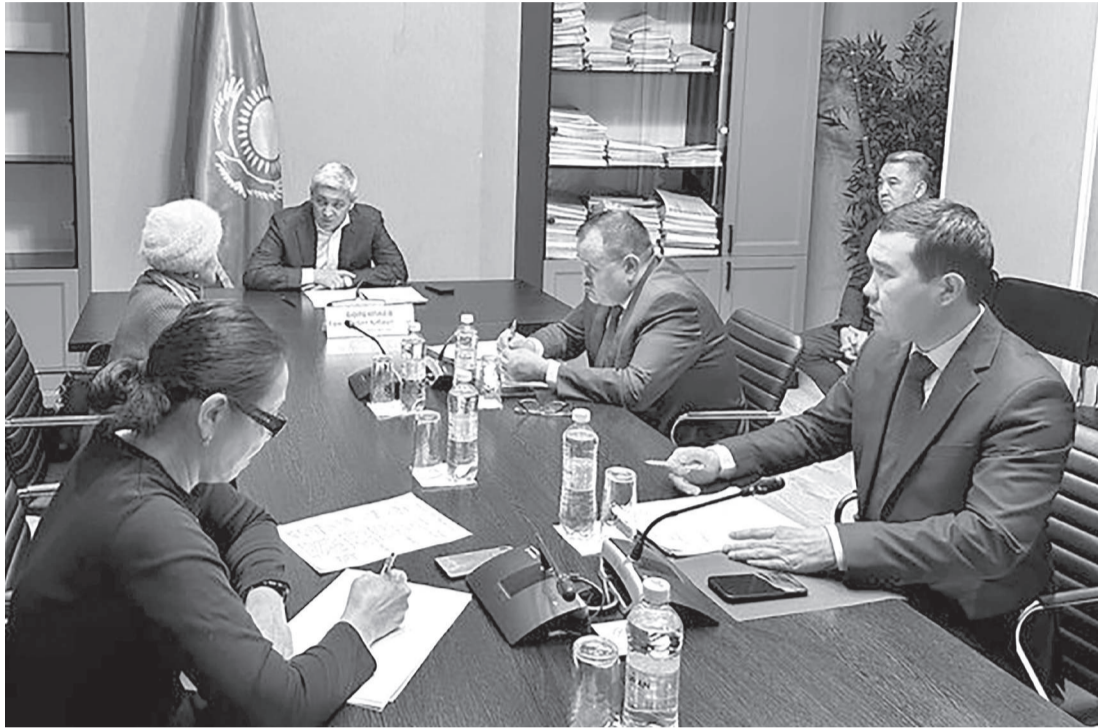
Сурет облыс әкімінің сөйлеуінен