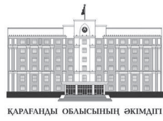
ҚАРАҒАНДА ОБЛАСЫНЫҢ ӘЖІМАТІ