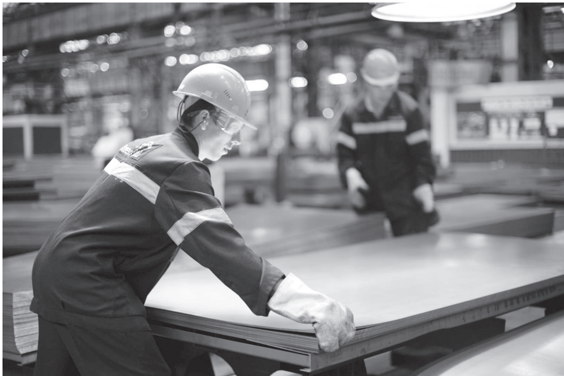
Сурет шығармашылық бағдарламалар