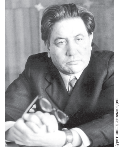
Сурет шыққан дереккөзінен

Евней Бөкетов көмірді және басқа минералды ресурстарды өңдеу кезінде болатын термодинамикалық процестерді зерттеді. Оның кен шикізатының химиялық термодинамикасы және химиялық қосылыстар теориясы жөніндегі жұмыстары Қазақстанның табиғи ресурстарын өңдеу әдістерін