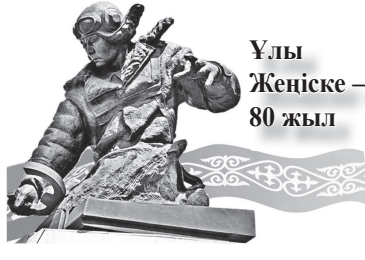
Ұлы Жеңіске – 80 жыл

Биыл халқымыз айтулы мереке – Ұлы Отан соғысындағы Жеңістің 80 жылдығын атап өтпек. Адамзат тарихындағы аса қасіретті Екінші Дүниежүзілік соғыста 50 миллион адам қаза болып, мыңдаған қалалар мен селолар қирағаны мәлім. Атом бомбасы сияқты аса жойқын қару ойлап табылып, оны америка империалистері Жапонияның Хиросима мен Нагасаки қалаларының үстіне жарып, бейбіт халқын айуандықпен қырып салды. Міне, сондықтан да, ізгі ниетті адамзат баласы сұрапыл соғыстың аяқталуын қуанышпен қабылдап, Жеңіс күнін қашан да зор салтанатпен атап өтеді. Майдангерлер мен тыл еңбеккерлерінің көзсіз ерліктерін, соғыстың зардаптарын еске алып, мұндай қасіреттің қайталанбауын тілейді.