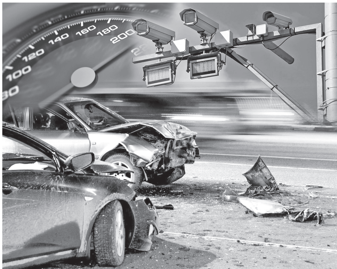
Қолжазба жасаған Ш.Адамбеков

Көліктің мас күйінде, оның ішінде, басқару құқығынан айырылса да жүргізу, бұл – көбінесе қиын салдарларға алып келетін ереже бұзудың ең ауыр түрінің бірі. Сондықтан, оның жазасы да қатан. Бірақ, соған қарамастан, өзінің ғана емес, өзгенің де өмірін қатерге тігіп, рульге отыратындар бар. Мәселен, өткен жылы облыс бойынша Қылмыстық кодекстің 346-бабы бойынша құзырлы орган сотта қарау үшін 93 қылмыстық істі жолдаған. Бұл көрсеткіш 2023 жылмен салыстырғанда алдекайда жоғары. Атап айтқанда, 35 пайызға өскенін көрсетеді статистикалық деректер.