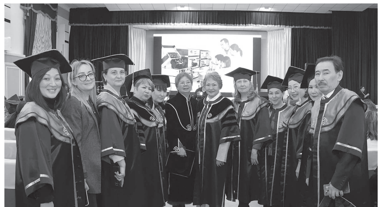
Университеттің 75 жылдығын тойлау сәті