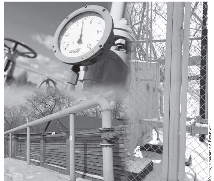
Коллекция жасаушы А.Рыскулова

Ендігіде төртінші, бесінші және алтыншы іске қосу кешендерінде жұмыс жалғасуда. Қаланың Федоров, Кирзавод деп аталатын бөліктерінде жоғары және