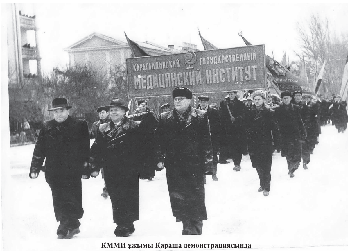
ҚММИ ұжымы Қараша демонстрациясында