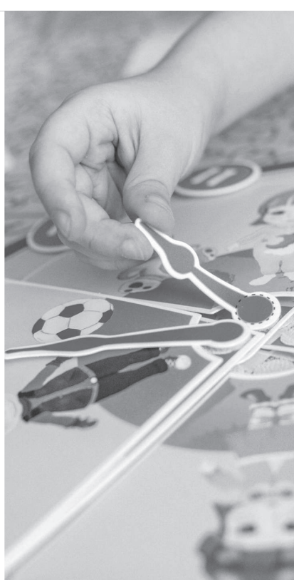
Коллаж жасаған Ш.Аманжол

са, нашар ұйықтаса немесе серуендеуге қашан бару керектігін білмесе, онда маман виртуалды балабақша көмегімен отбасымен жұмыс істейді, көмек көрсетеді. Бала әрі қарай платформадан дамытушы мультфильмдерді көре алады.