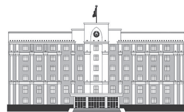
ҚАРАҒАНДЫ ОБЛЫСЫНЫҢ ӘКІМДІГІ

түсетіні сөзсіз. Өткен жылы аудан экономикасында оң өзгерістер мен ілгерілеу болғаны елге белгілі. Енді, осы мүмкіндікті пайдаланып, жергілікті кәсіпорындар мен тауар