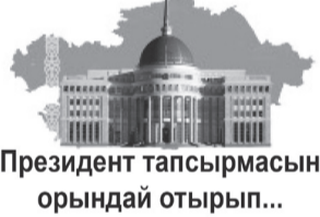
Президент тапсырмасын орындай отырып...