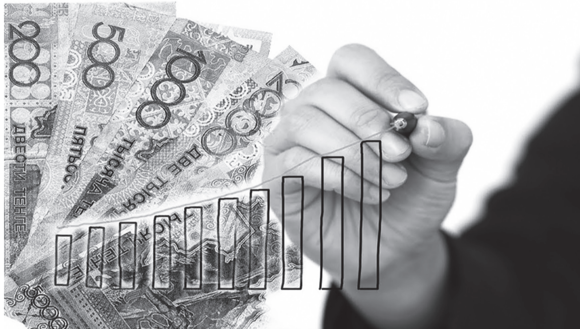
Сурет шыққан дереккөзінен алынды

Жол жүру ережелеріне де қатысты өзгеріс бар. Жылдамдық тәртібін сағатына 60 шақырымға және одан артық асырғаны үшін 40 АЕК көлемінде айыппұл қарастырылған. Ал, осы құқықбұзушылық бір жылдың ішінде қайталанса, ай-