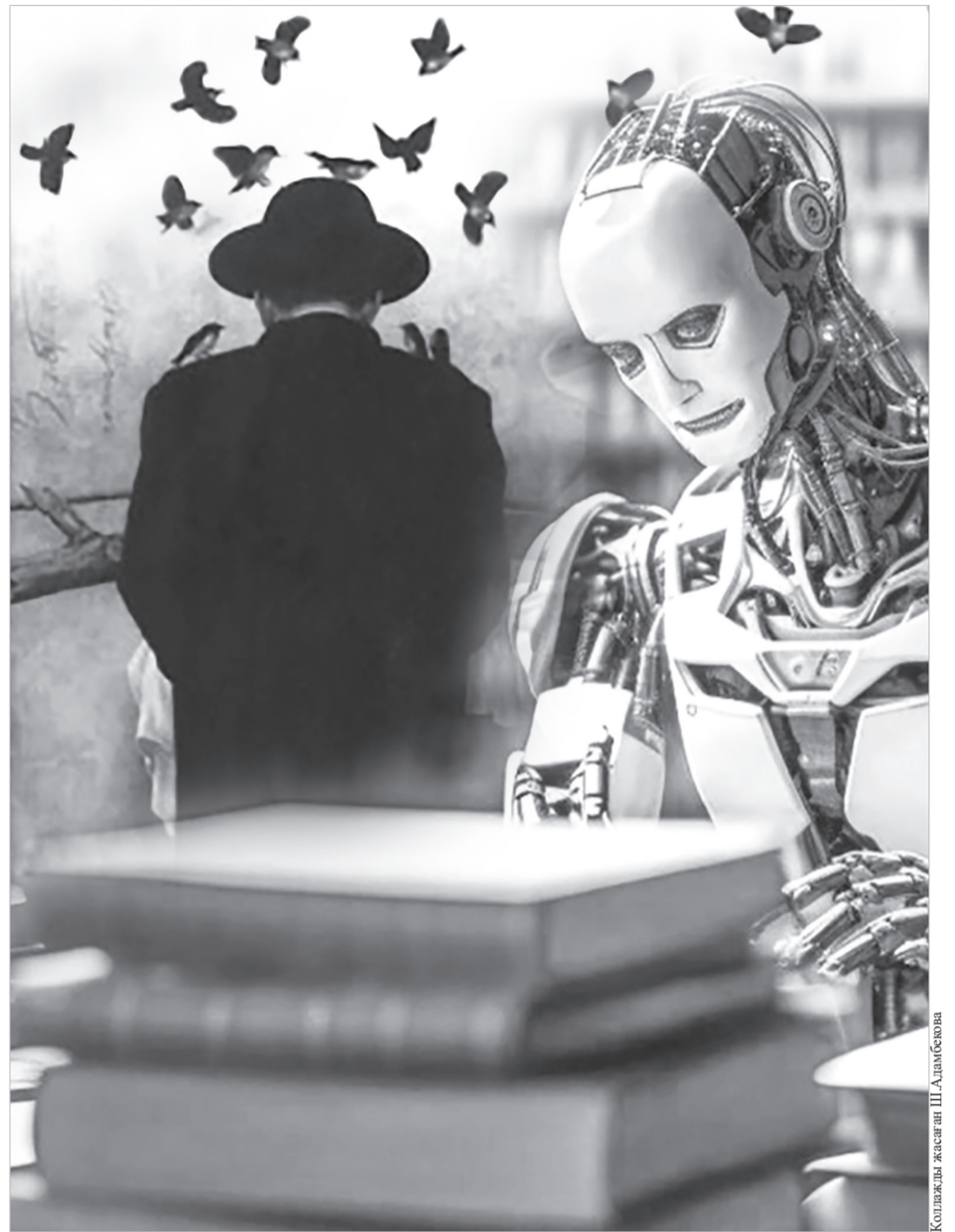
Коллаж жасаған Ш.Адамбеков

– Қазір студенттер чат GPT-дің мүмкіндіктерін толық игерген. Әлбетте, бұл бір жағынан қарағанда жақсы. Студенттер жана технологияларды игергені абзал. Бірақ, әр нәрсенің өз шегі бар. Мұғалімнің, жалпы, білім беру жүйесінің