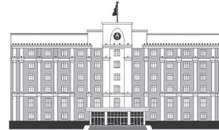
ҚАРАҒАНДЫ ОБЛАСЫНЫҢ ӘКІМДІГІ

дандыру бойынша мемлекеттік сараптаманың оң қорытындысын алған жобалар бар. Оның құрылысы және жоғары қысымды газ құбырының құрылысы аяқталды, Северо-Западный кентінде төмен қысымды газ құбыры мен шығу тораптары салынуда. Биыл газбен қамту жобаларына 14,6 млрд теңге бөлінді. Республикалық бюджеттен – 3,1 млрд теңге, қала бюджеттерінен – 3,5 млрд теңге, сонымен қатар, «Самұрық-Қазына» ҰӘҚ-нан 8 млрд теңге, – деді.