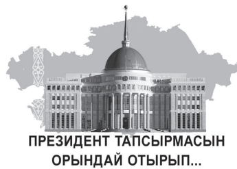
ПРЕЗИДЕНТ ТАПСЫРМАСЫН ОРЫНДАЙ ОТЫРЫП...

Жақында Ақтоғай ауданында жаңадан бой көтерген қос пәтерлі тұрғын үйлер пайдалануға берілді. Онда Ақтоғай ауылы бойынша мемлекеттік тұрғын үй есебінде тұрған қобалалы және үйлері апаттық жағдайдағы отбасылар қоныстанды. Кейінгі жылдары құрылысы басталған Солтүстік-Батыс ықшам ауданындағы пәтерлердің барлығы да орталықтандырылған су жүйелеріне, электр қуатына қосылған.