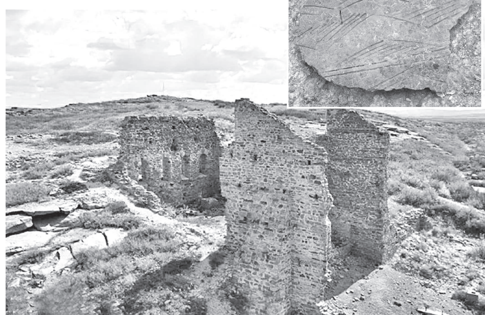
байыту фабрикасының қирандыларын әуеден түрлі ракурстан бейнеге, суретке түсіріп алды. – Бұл зауыттың қирандылары облы-

Бұдан бөлек, ғалымдар XX ғасырдың басында британдық инженер-конструктор Джон Уилфорд Уорделл салған Сарысу