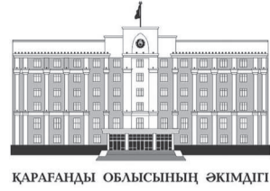
ҚАРАҒАНДЫ ОБЛАСЫНЫҢ ӘКІМДІГІ