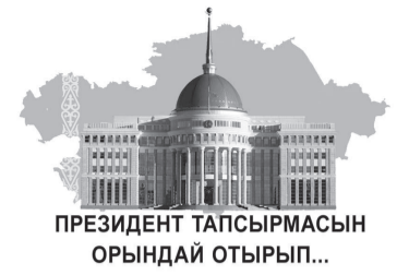
ПРЕЗИДЕНТ ТАПСЫРМАСЫН ОРЫНДАЙ ОТЫРЫП...

– Аталған жоба 2018 жылдан қолға алынған. Осы уақыт ішінде 115 туберкулезбен ауыратын тұрғылықты жері жоқ адам анықталды. Оның 40 пайызында бактериялық түрі екені де белгілі болды. Біздің аутич қызметкерлер болмаса, бұл адамдар өз бетінше ешқашан емдеу мекемелеріне бармас еді. Егер бір науқас туберкулезді 10-