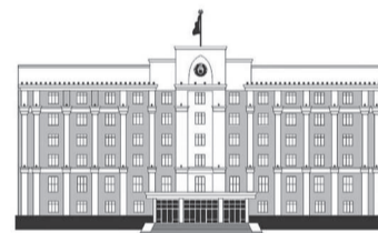
ҚАРАҒАНДЫ ОБЛАСЫНЫҢ ӘКІМДІГІ