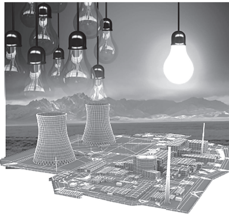
Коллаж жасаған А. Көптегев

қолданса, елімізде АЭС үшін шикізат тапшылығы болмайды. Қазір елімізде және шет елден де білім алып келіп жатқан жас мамандар жеткілікті.