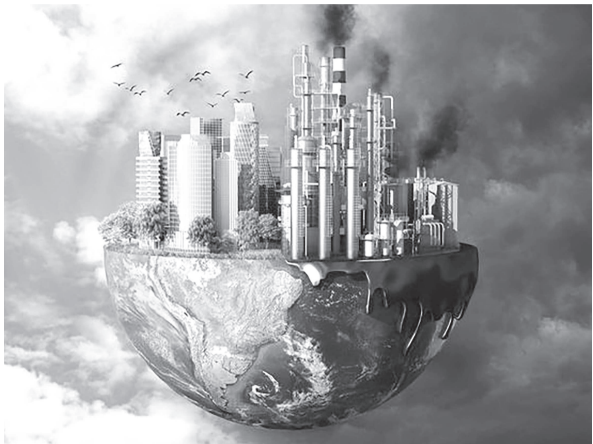
Коллажы жасаған А.Рахымжан

АЭС Қазақстанға электр энергиясын өндіруде түрлі көздерді пайдалануға мүмкіндік береді. Бұл көмір мен газға тәуелділікті жояды. АЭС-те электр энергиясын өндіру құны электр станцияларының басқа түрлеріне қарағанда төмен болуы мүмкін. Атмосфераға көмірқышқыл газының шығарылуы, импорттық энергия көздеріне тәуелділік азаяды, бұл елді энергиямен жабдықтауда тұрақтылықты қамтамасыз етеді.