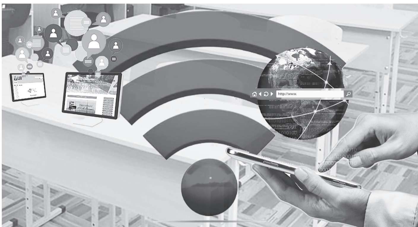
Коллаж жасаған А. Коптеева