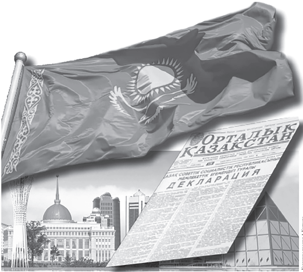
Коллажды жасаған А.Колесова

Қазақстанның жаңа тарихы «Мемлекеттік егемендік туралы Декларациядан» бастау аларына дау жоқ. Тура 34 жыл бұрын қабылданған Декларациядан бері қазақ елі өзін әлем алдында сыртқы-ішкі саясатта мойындата білген біртұтас мемлекетке айналды. 25 қазан – Республика күні ретінде мерекеленіп келгені белгілі. Одан кейініректе мереке тізімінен шығарылды. Ал 2022 жылғы 16 шілдедегі Ұлттық Құрылтайда Президент Қасым-Жомарт Тоқаев ұлттық мереке мәртебесін Республика күніне қайтаруды ұсынғаны және оның қолдау тапқаны мәлім.