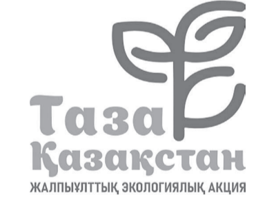
ЖАЛПЫҰЛТТЫҚ ЭКОЛОГИЯЛЫҚ АКЦИЯ

Экологиялық жағдайды жақсарту үшін ауданда қатты тұрмыстық