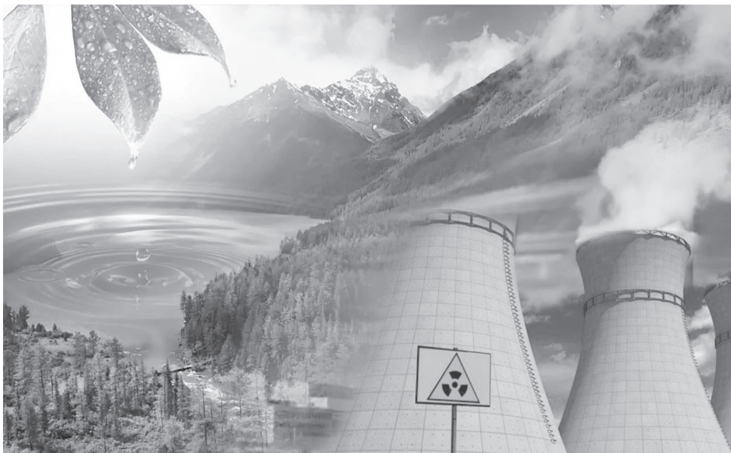
Коллажды жасаған А.Рахымжанов

Еуроодақ елдері 2050 жылға қарай экономиканы көмірсутектен арылтуды мақсат етіп отырғанын білесіздер. Ал қазірдің өзінде әлемнің кейбір жетекші елдері осы мақсатта жұмысқа белсене кірісін кетті. Олар тіпті 2050 емес, 2035-2040 жылдарға дейін осы талапқа жетпек ниетте. Осы орайда Қазақстанның болашақта таза қуат көзі АЭС-ке қошуі құптарлық іс. Өйткені, атом – таза генерация түрі.