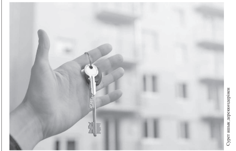
Сурет облыс әкімінің сайынан