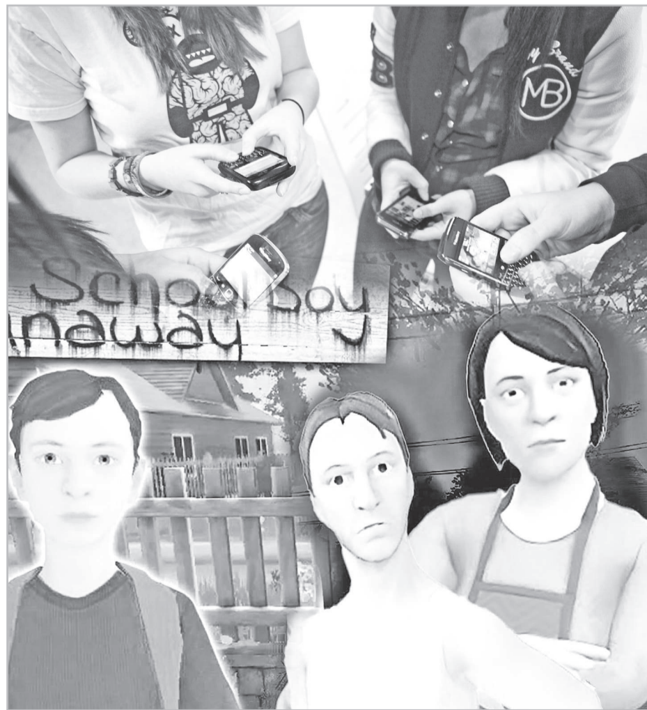
Коллаж жасаған Ш. Адамбеков

Бұған дейін әлеуметтік желіде кең таралған Among Us ойыны жайлы да ата-аналардың өтінішін ескерген Балалардың құқықтарын қорғау комитеті жедел түрде Мәдениет және ақпарат министрлігінен балаға зиян келтіруі мүмкін Among Us