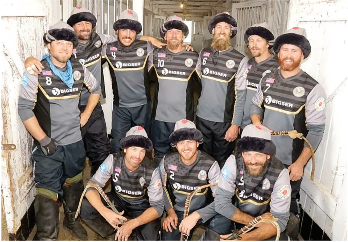
Суретте көкпардан АҚШ командасының мүшелері

Түбі бір түркі тілдес мемлекеттерден бөлек, Еуропа елдерін қосқанда 89 мемлекет қатысқалы отырған V Дүниежүзілік көшпенділер ойындары басталғалы тұр. Алыс-жақын шетелден келетін қатысушылардың алды Астанаға ат басын тіреді. Қырғыз ағайындар ұлы аламанға қатысар жүйріктерін күнібұрын Қазақстанға әкеліп, жергілікті климатқа үйретіп жатыр. Атағы Алатау асқан күлік барша қырғыз мақтанышы «Қарақызы» да біздің елде бәйгеге бапталып дайын тұр. Тіпті, америкалық көкпар командасының көкпарға дайындықтарының өзі алты құрлық асып, желіде қызу талқыға түскені мәлім.