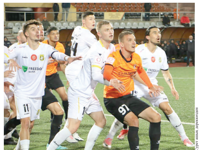
Сурет шық. Лерекөкпен

Премьер-лиганың 20-туры аясында «Шахтер» «Тұран» командасымен ойнау үшін Түркістанға қонаққа барады.