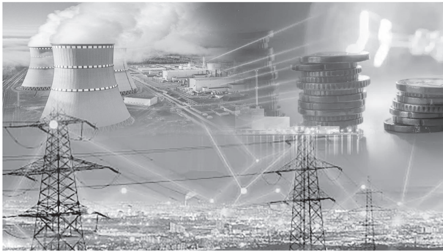
Коллаж жасаған А.Рысқалиев

Ғылыми зерттеулерге арналған техникалық база, жаңартылған зерттеу реакторлары мен алдыңғы қатарлы университеттерде ядролық технологиялар саласындағы жоғары білікті мамандарды даярлау үшін тамаша жағдайлар жасалған. Мұның барлығы Қазақстанға уран өндіру саласындағы көшбасшылық позициясын сақтап қана қоймай, өз энергетикалық қажеттіліктерін қанағаттандыру үшін атом энергетикасын дамытуға зор мүмкіндік береді және біздің елді жаһандық ядролық ғылым мен технологияда маңызды «ойыншы» ретінде танытады.