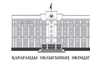
ҚАРАҒАНДЫ ОБЛЫСЫНЫҢ ӘКІМДІГІ

Одан бөлек, кездесуде әлеуметтік қамсыздандыру, бизнеске жәрдемдесу де назардан тыс қалмады.