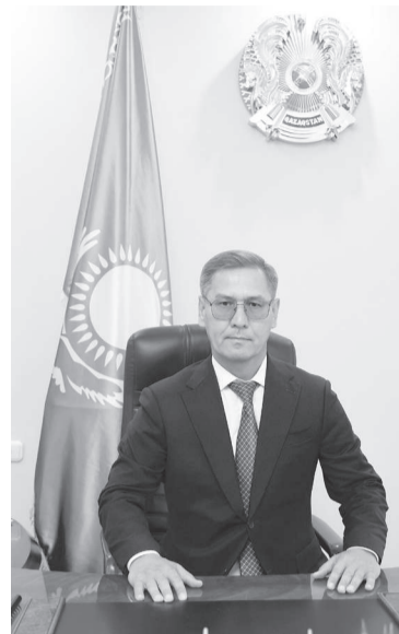
жұмысы бөлімінің бас маманы болып еңбек етті.

Еңбек жолын 1999 жылы бастаған. 2007 жылдан бастап, мемлекеттік қызметте. Қарағанды облысы кәсіпкерлік және өнеркәсіп департаментінің қаржы, ұйымдастыру және кадр