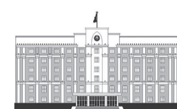
ҚАРАҒАНДЫ ОБЛЫСЫНЫҢ ӘКІМДІГІ

– Биыл ұзындығы 104 шақырымдық үш учаскеге мердігерлік ұйым анықталды, бұл «Көбетей – Нұра» учаскесіндегі 31 шақырым және Ынтымақ ауылынан «Алматы – Екатеринбург – Теміртау» автожолына дейінгі 73 шақырым. Қазір Нұрадан Ақмола облысына қарай 7 шақырым жерде жұмыстар атқарылды. Сондай-ақ, «Көбетей – Нұра» учаскесінде жеті су өткізу құбырын және «Ынтымақ – Теміртау» учаскесінде алты су өт-