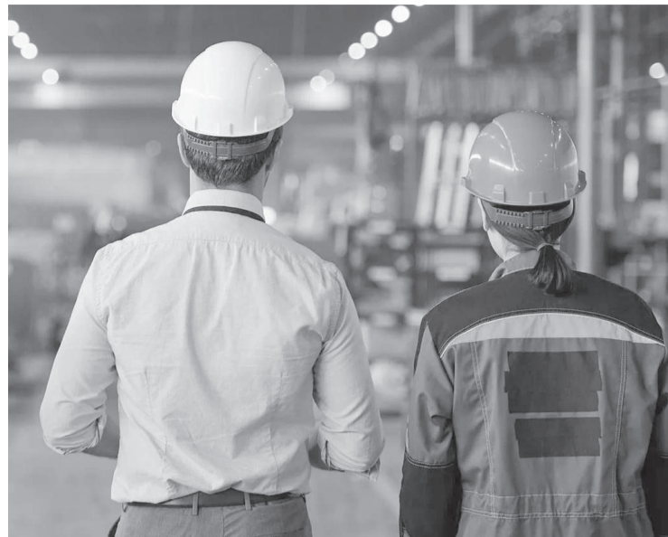
(Соңы. Басы 1-бетте)

Сондықтан да, Президент Жолдауында биыл тағы еңбек адамының мәртебесіне баса мән берді. Тіпті, сол жұмысшы мамандардың біліктілігін арттырып, кадрлық әлеуетін жоғарылату үшін 2025 жылды «Жұмысшы мамандықтар жылы» деп жария еткені белгілі.