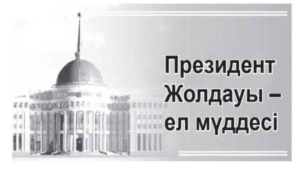
Президент Жолдауы – ел мүддесі