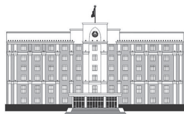
ҚАРАҒАНДЫ ОБЛЫСЫНЫҢ ӨКІМДІГІ