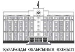
ҚАРАҒАНДЫ ОБЛЫСЫНЫҢ ӨКІМДІГІ

Аймақта мүгедектігі бар адамдардың 53%-ы еңбекке қабілетті. Оларды жұмыспен қамту – жергілікті атқарушы билік өкілдері міндеттерінің бірі. Облыс әкімі Ермағанбет Бөлекпаев кешегі аппарат жиынында мүгедектігі бар адамдарды жұмыспен қамту шараларын жандандыруды тапсырды.