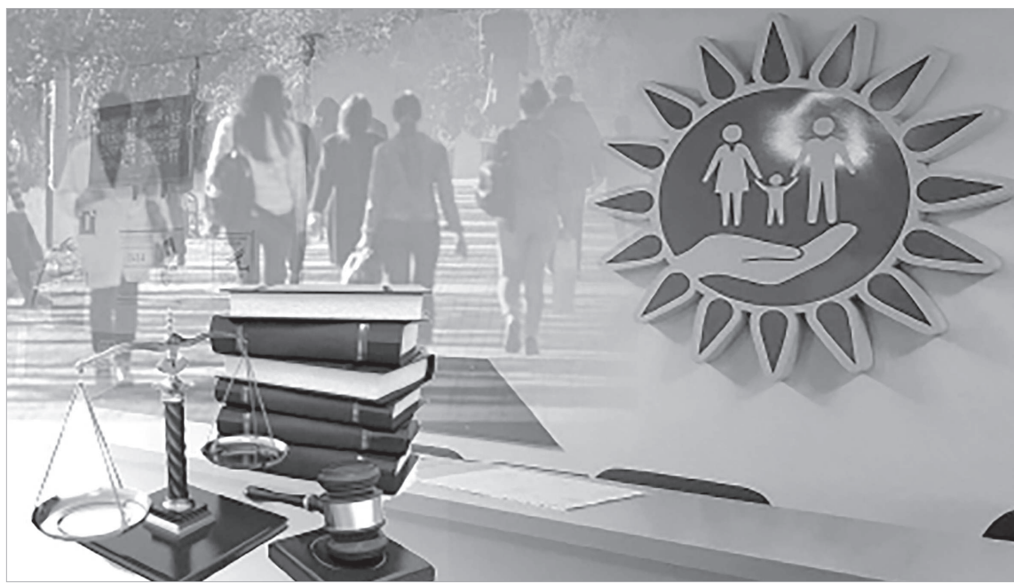
Коллаж жасаған А. Котгеева

Жылжымайтын мүлік, не автокөлікті тіркеу, пәтерге я тегін 10 сотық жерді алуға кезекке тұру, кейбір лицензиялар мен рұқсаттарды алу және бұдан өзге де жүздеген қызметтер мемлекеттік көрсетілетін қызметтерге жатады. Ол «Мемлекеттік көрсетілетін қызметтер туралы» арнайы Заңмен және көрсетілетін қызметтің стандарттары егжей-тегжейлі баяндалған ведомствалық бұйрықтармен реттеледі. Көрсетілген мемлекеттік қызметтерге көңілі толмаған азаматтар сотқа жүгінуге хақылы.