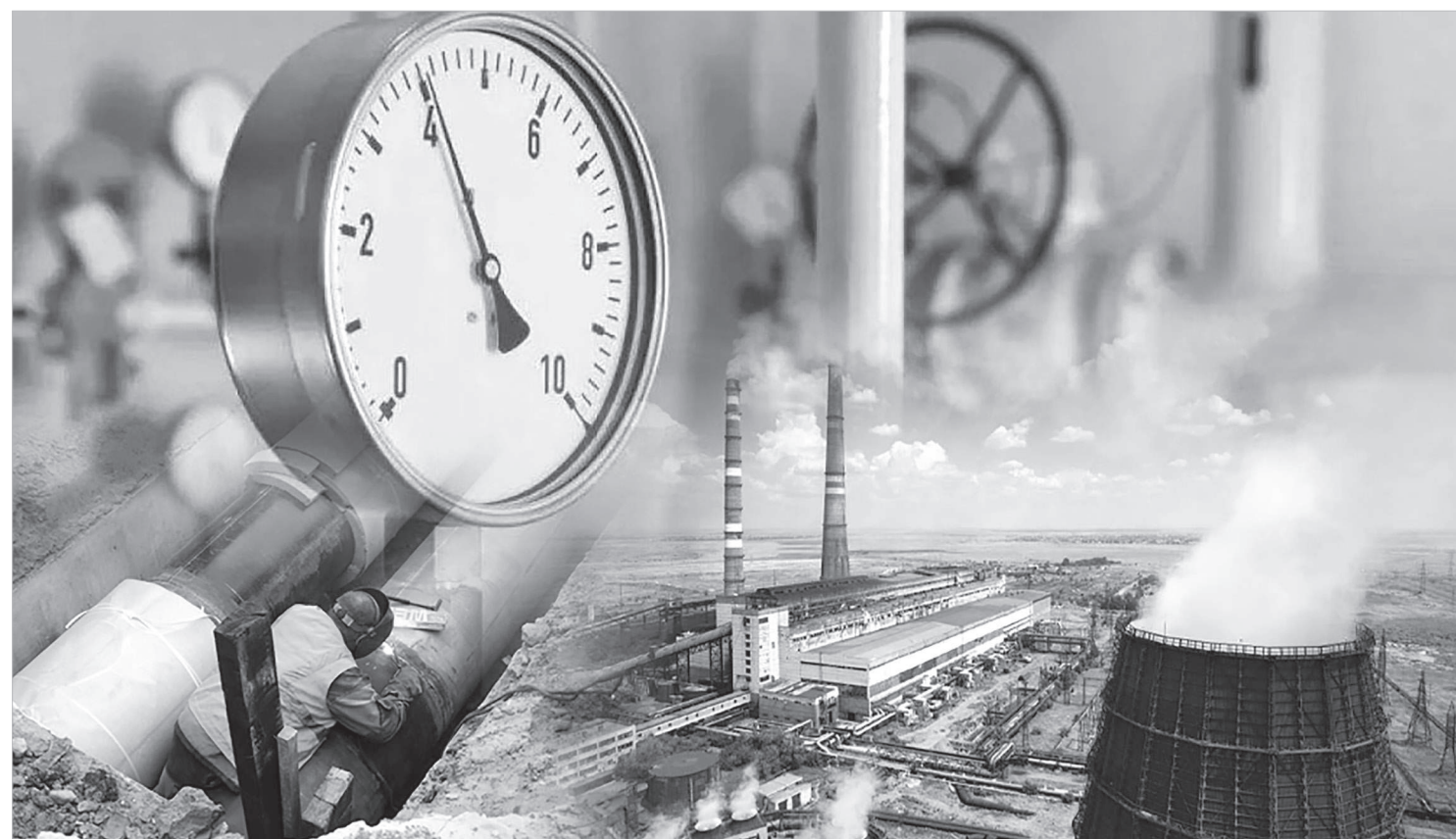
Коллажы жасаған Ш.Алашбекова