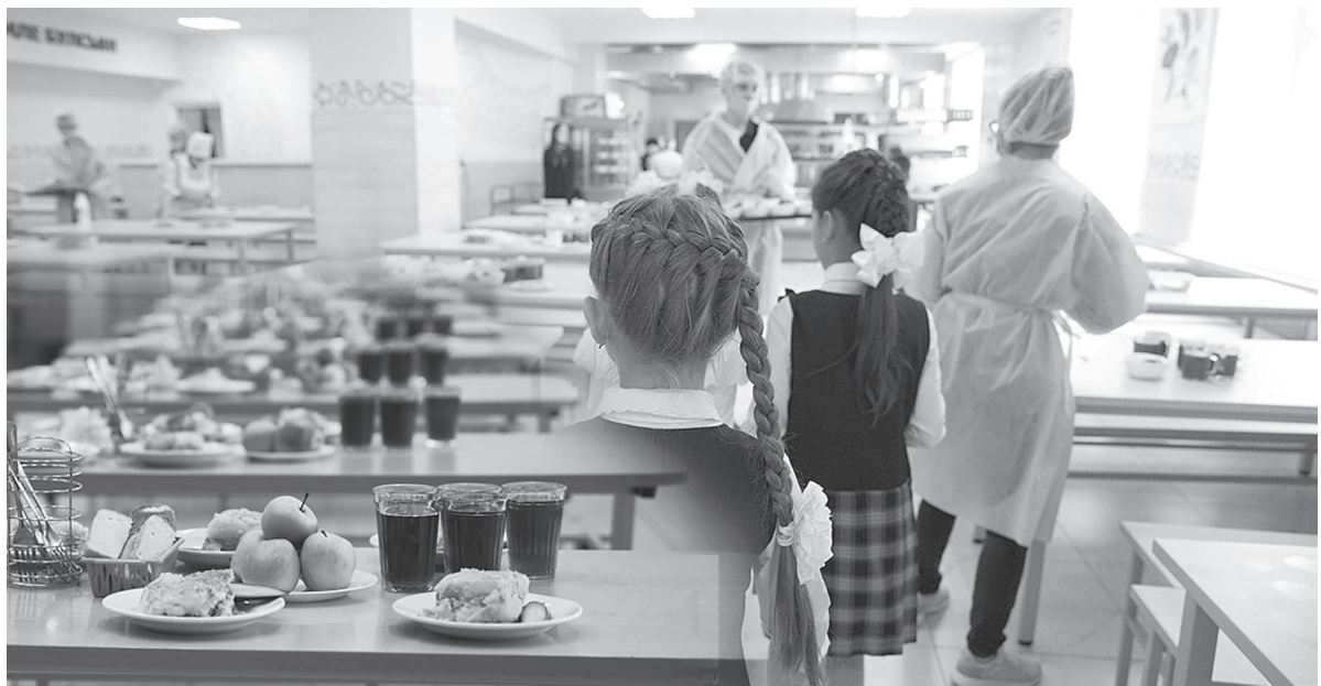
Коллаж жасаған А.Рысқалиев

Қарағанды облысының санитариялық-эпидемиологиялық бақылау департаменті тамақтану мен жігіт ішек инфекцияларының алдын алу – мектеп оқушыларын тамақтандыру қызметін көрсететін шаруашылық жүргізуші субъектілердің негізгі міндеттерінің бірі екенін еске салады.