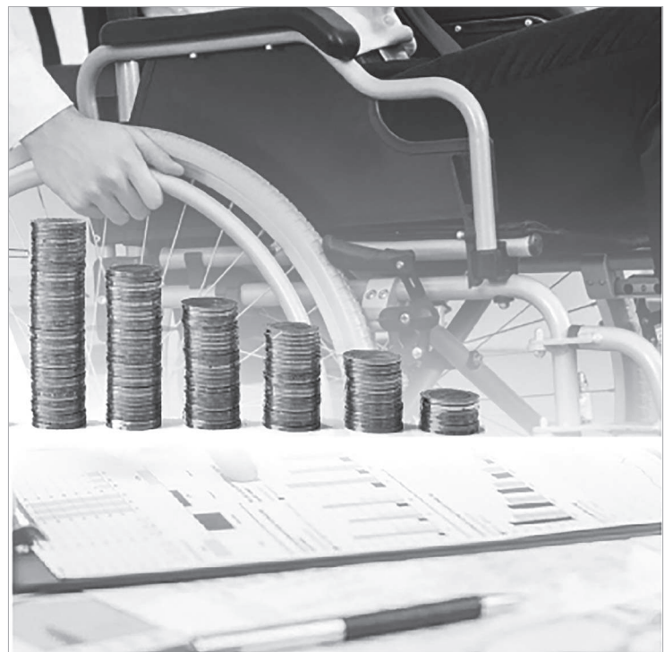
Коллаж жасаған А. Котгеева

Биыл гранттар алуға өтініштерді қабылдау 2 лек бойынша өткізілді. Үміткерлерден барлығы 30 мыңнан астам өтініш келіп түскен. Гранттарды еңбек мобильділігі орталықтары үміткерлердің өтініштерін қарау жөніндегі аудандық – қалалық комиссияның шешімі негізінде береді. Үміткерлер өздерінің бизнес-жобаларын комиссия отырыстарында таныстырады. Комиссия отырысының өткізілетін орны, күні мен уақыты туралы хабарлама Business.enbek.kz порталында грант алуға өтініш берушінің жеке кабинетінде көр-