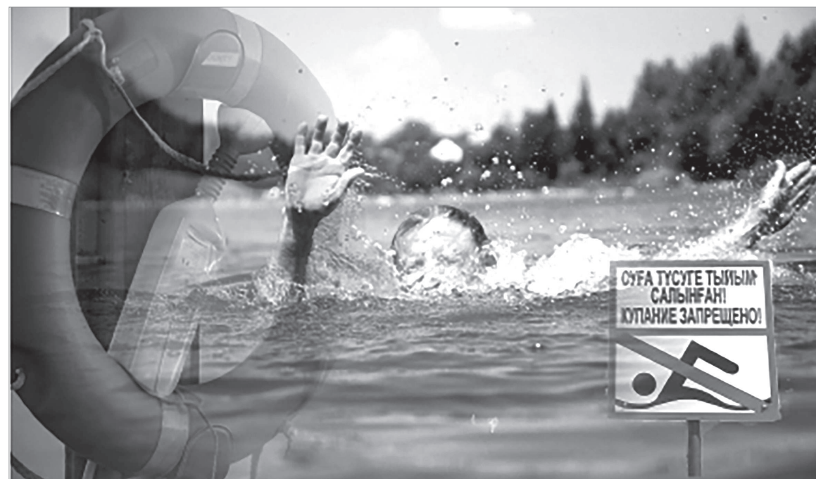
Коллаж жасаған А. Котгеева

– «Судағы қауіпсіздік» тақырыбы бойынша 240 акция, сауда үйлерінің дауыс зорайтқыштары арқылы қауіпсіздік ережелері туралы 1 жарым мың аудио хабарландыру жүргізілді. Судағы қауіпсіздікті қамтамасыз етудің тағы бір жолы, қауіпсіз демалыс орындарын ұйымдастыру болып табылады. Облысымызда 89 жаппай демалу және суда жүзу орны бекітілген. Соның ішінде, 5 коммуналдық және суда спортпен шұғылдану үшін 1 орын бар. Сонымен қатар, коммуналдық жағажайларды құру жоспарына сәйкес облыстың 12 елді мекенінде 19 қосымша жағажай құру жоспарланған. Биыл жоспар аясында Осакаров ауданының аумағында 3 коммуналдық жағажай құрылды. Айта кету керек, барлық коммуналдық жағажайлар