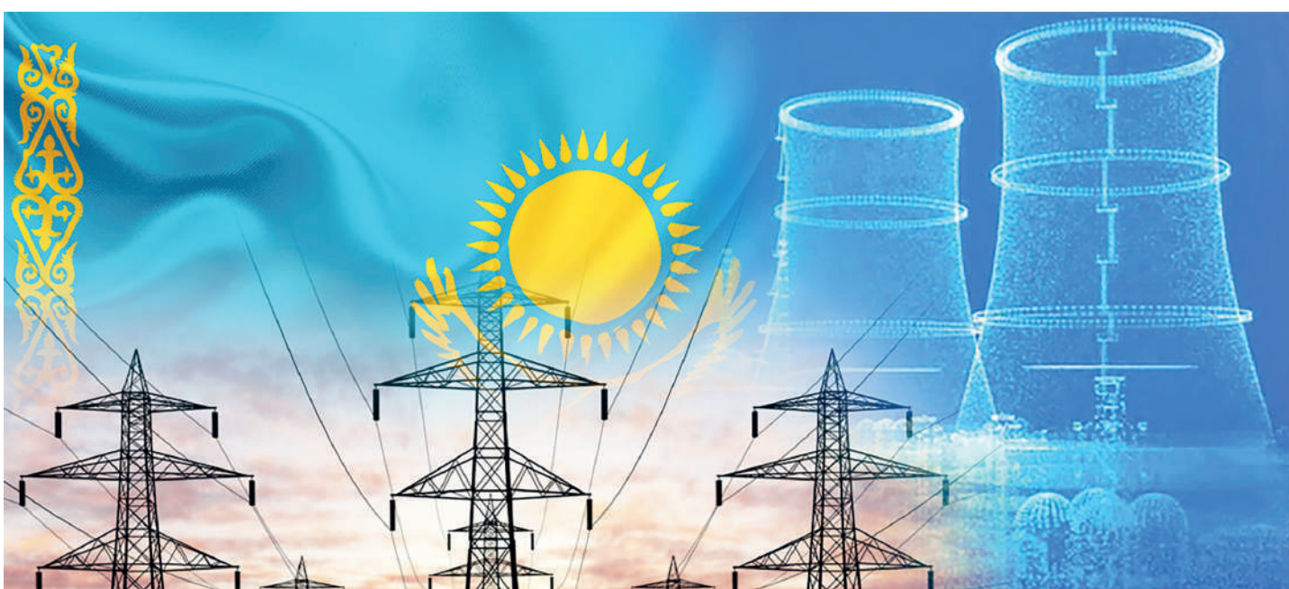
Коллаж жасаған Ш.Адамбекова