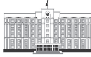
ҚАРАҒАНДЫ ОБЛЫСЫНЫҢ ӘКІМДІГІ

екенін де назардан тыс қалдырмады. Осыған орай делегация құрамында Новгород мемлекеттік университетінің ректорының да келгенін атап өткен жөн.