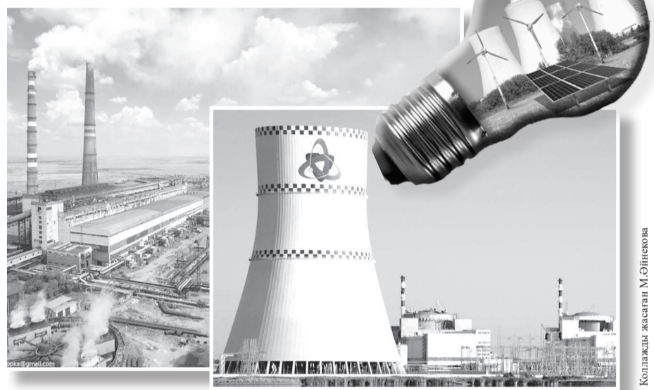
Коллаж жасаған М.Әлімовна