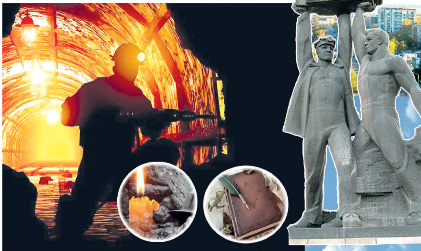
Коллаж жасаған М.Әлимова

Ал, ақын өлеңінде қасиетті Қарағанды – көмір ғана емес, адам тағдырының метафорасы. Шамырқанған шайырлар жыр жолдарында шаруашыл шаһар қайшылықтар айғағы ретінде қылаңытады. Байлық пен кедейлік, күш пен осалдық. Шаңды шахталарда машиналар дауылының арасында болат тәрізді берік әрі көмір тозаны сияқты сынғыш ерлер бей-