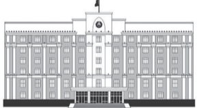
ҚАРАҒАНДЫ ОБЛЫСЫНЫҢ ӘКІМІ

Бастауышта білім дұрыс беріліп, бала бойындағы білім-ғылымның негізі дұрыс қалған, бәсекеге қабілетті, ойы ұшқыр, қиялы жүрік болып өседі. Облыс аумағындағы «Жайлы мектептерді» салудағы басты мақсат – осы. Балқаш қаласы Қазыбек Нұржанов атындағы шағын ауданда 900 орындық жайлы мектептің құрылысы қарқынды жүргізілуде. Бүгінде оқытушылар құрамы мен сыныптарды алдын-ала жасақтау жүріп жатыр.