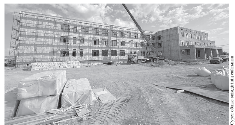
Сурет облыс әкімінің кабинетінде