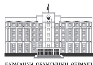
ҚАРАҒАНДЫ ОБЛЫСЫНЫҢ ӘКІМДІГІ

Қарағанды облысында өңірлік кадр резервіне іріктеудің соңғы кезеңдері өтуде. Құзыреттілігін бағалаудан өткен қырық үш үміткер комиссиядағы құрылымдық сұхбатқа жіберілді.