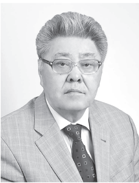
«Жауынгерлік Даңқ» лентасы мен төсбелгілері сияқты 5 ұлттық жобаны іске асырды.