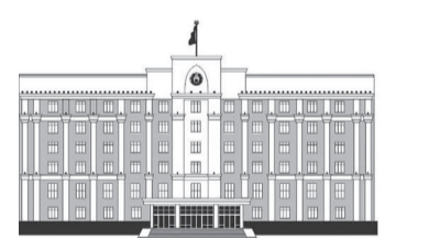
ҚАРАҒАНДЫ ОБЛЫСЫНЫҢ ӘКІМДІГІ

Биыл үшінші жылу шығару құбырын іске қосу көзделіп отыр. Шамамен 3 шақырым желіні төсеу және қысымын тексеру мен тол-