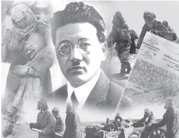
Коллажы жасаған М.Өлкенбаева

1921 жылғы Торғай уезіндегі ашаршылықтың негізгі себебі империялық замандағы заң актілерінің нормаларынан бастау алады. Ашаршылыққа себеп болған басты үшеуінің атын атап, түсін түстеп өтер болсақ, олар – 1822 жылғы Сібір қазақтары туралы Устав, 1861 жылы шаруаларды басыбайлы тәуелділіктен жерсіз босату актісі, 1868 жылғы Уақытша ережесі. Оқырманға түсінікті болуы үшін жоғарыдағы үш актіге қысқаша түсіндірме де бере кеткен жөн болар.