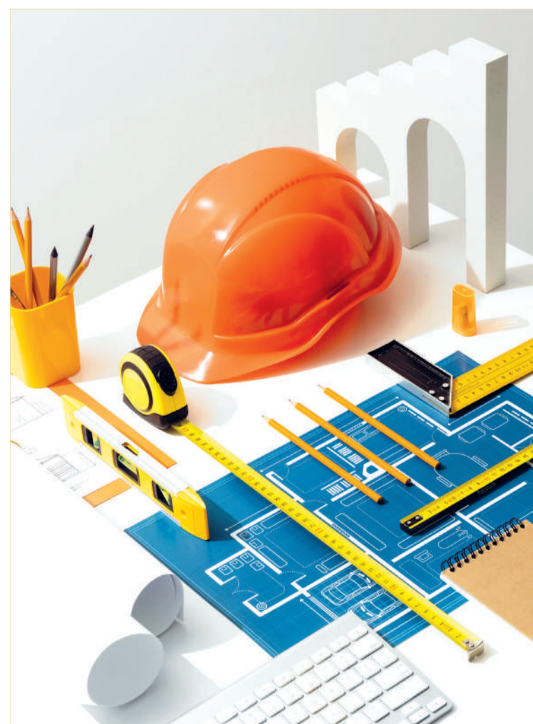
Сурет ашық жердегі

– Біздің көптептері үй 1937 жылы салынған. Сіз түсінесіз бе?! Ал, осы маңнан тағы бір зәулім үймерет салмақшы. Жер қазады. Котлаван жасайды. Коммуникациялық желінің тозығы жеткен. Су қысымы да көңіл көншітпейді. Бұған әлгі көршілес үйді қосайық. Қыста жылуудан, жазда судан таршылық көреміз деген сөз емес пе бұл?! – дейді наразылығын