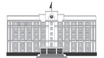
ҚАРАҒАНДЫ ОБЛАСЫНЫҢ ӘКІМДІГІ

Қала әкімінің мәлімдеуінше, қалада барлығы 598 көппәтерлі тұрғын үй бар. Олардың жылыту маусымына дайындығы штаттық режимде жүзеге асырылуда. Бүгінде 186 көппәтерлі тұрғын үйге гидравликалық жұмыстар жүргізілген. 182 көппәтерлі тұрғын үйге «Балқаш жылу» ЖШС тарапынан 100% дайындық актілері берілген. 11 көп қабатты үйдің фасадтары мен шатырларын жөндеу жоспарланған. Бүгінгі күні барлық үйлерде жұмыстар жүргізілуде. Шағын кәсіпкерліктің дамуы қала экономикасында маңызды роль атқарады. Қазіргі таңда шағын және орта субъектілері 6045 бірлікті құрайды. Кәсіпкерлікті дамыту аясында биылғы жылы «субсидиялау» бойынша 32 жоба және «кепілдік беру» бойынша 4 жоба мақұлданды. Мемлекеттік грант тамыз-қыркүйек айларында беріледі. Қалада туристік имиджді қалыптастыру бағытында біртұтас шаруа қолға алынған. Туризмді дамыту бойынша қалада 20 қонақ үй және Торанғылық, Шұбартүбекті қосқанда 1224 нөмірлі 58 демалыс орны бар. Бүгінгі күні 7 демалыс орнының құрылысы жүргізілуде. Былтыр жүз мыңға жуық туристер демалды.