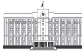
ҚАРАҒАНДЫ ОБЛАСЫНЫҢ ӘКІМДІГІ

көбісі несие алған. Құрылыс салушы бізді түкке тұрғысыз уәделермен тойдырды. «Алтын» ТК құрылысы өткен жылы басталуы тиіс еді. Алайда, болашақ үйдің орнында коммуникациялар өтетіні белгілі болды. Қала әкімдігі құрылыс салушының жағдайына түсіністікпен қарап,