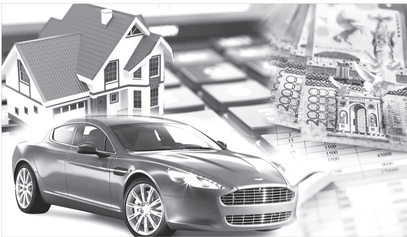
Коллажты әзірлеген Ш.Адамбекова

Президент Қасым-Жомарт Тоқаев «Әділетті мемлекет. Біртұтас ұлт. Берекелі қоғам» атты Жолдауында фискалды реттеу ісін қайта жаңғырту үшін 2023 жылы жаңа Салық кодексі әзірленетінін айтқан болатын. Оның ең түйткілді тұсы саналатын салықтық әкімшілендіру мәселесі түгел қайта жазылуға тиіс деп, нақты тапсырма да берді. Осыған сәйкес, Мемлекет басшысы Салық кодексіне түзетулерге қол қойған болатын. Өзге де түзетулермен қатар, жаңа кодексте декларация мәселесі де назардан тыс қалған жоқ. Мәселен, биылғы жылдың 15 қыркүйегінен кешіктірмей тапсырылуы қажет жалпыға бірдей декларациялау және кірістер мен мүлік туралы декларация шеңберінде салық есептілігін табыс етудің бірыңғай мерзімі белгіленді. Одан бөлек, 2024 жылдың 1 қаңтарынан Жалпыға бірдей декларациялау жөніндегі науданың үшінші кезеңі басталғанын айту керек. Мұндағы негізгі міндет – сыбайлас жемқорлық пен көлеңкелі экономика деңгейін төмендету, жеке тұлғалардың кірістерін бақылаудың тиімді тетігін құру және әділ салық салуды қамтамасыз ету мен әлеуметтік саясатты жетілдіру болып отыр.