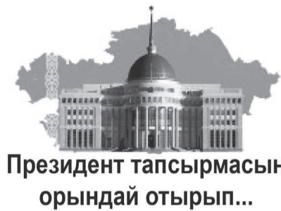
Президент тапсырмасын орындай отырып...