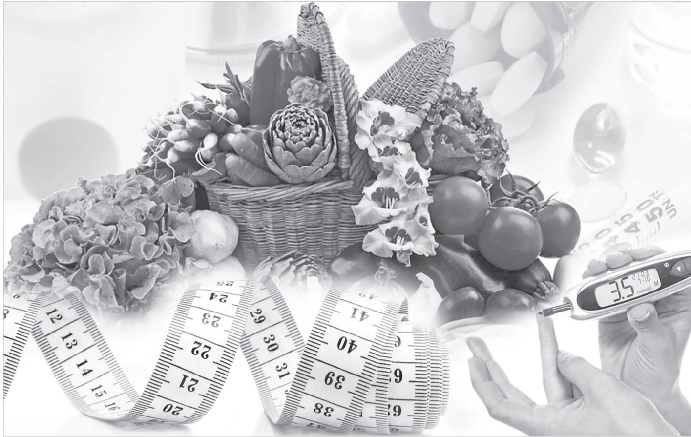
Коллаж жасаған Ш.Аманжолов

– Қант диабетінің екі типі және жүктілік кезінде пайда болатын гестационды түрі болады. Жүктілік кезінде балаға