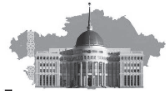
Президент тапсырмасын орындай отырып...

Мемлекет басшысы Қасым-Жомарт Тоқаев «Нақты ғылымдар мен инженерия саласы бойынша қосымша білім беруге айрықша назар аудару керек. Балаларды дене шынықтыру және академиялық тұрғыдан бірдей дамыту қажет. Ауылдық жерде тұратын балаларға баса мән берген жөн. Барлық аймақтағы балалардың қосымша білім алуына мүмкіндігі болуға тиіс», – деген болатын.