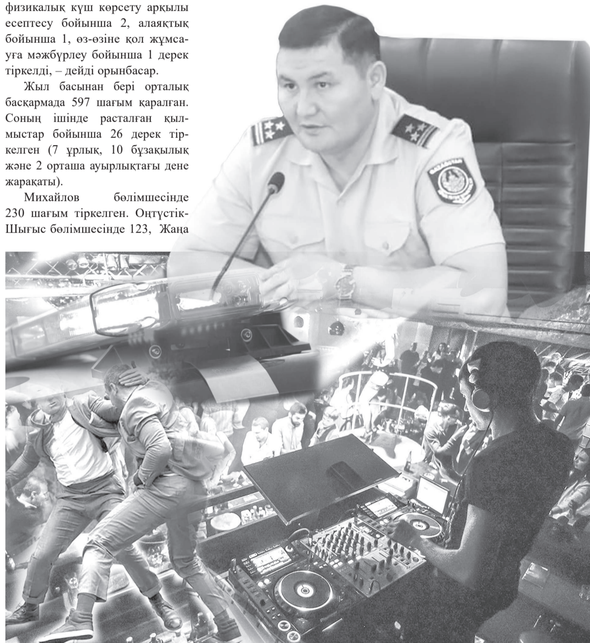
Коллаж жасаған А.Рысақов

Кейде күзетшілердің өзі сөз тындамаған қонақтарды төм-